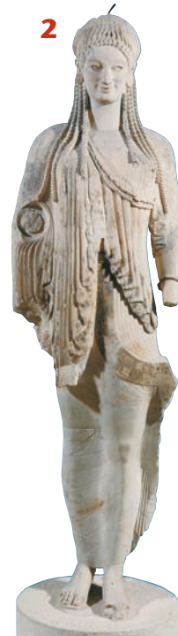
2 «Η κόρη της Ακρόπολης» (ΕΙΚ. 2).

Οι κόρες έχουν τα ίδια χαρακτηριστικά αλλά φορούν βαρύ πέπλο που σκεπάζει το σώμα τους. Είναι γλυπτά που ανήκουν στην αρχαϊκή περίοδο.