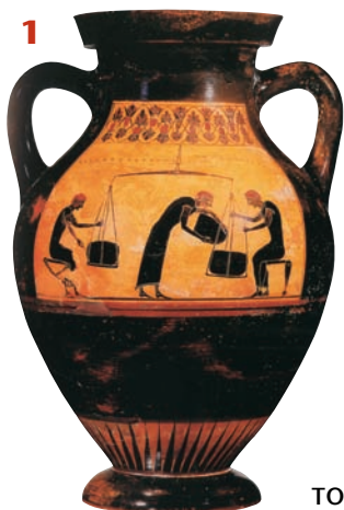
«Το ζύγισμα των εμπορευμάτων». Μελανόμορφο αγγείο (εικ.1,2).

Η αγγειοπλαστική τέχνη γνώρισε μεγάλη ανάπτυξη στην αρχαία Ελλάδα. Οι αγγειοπλάστες στα εργαστήρια κεραμικής κατασκεύαζαν πήλινα αγγεία για να καλύψουν τις καθημερινές ανάγκες των ανθρώπων.