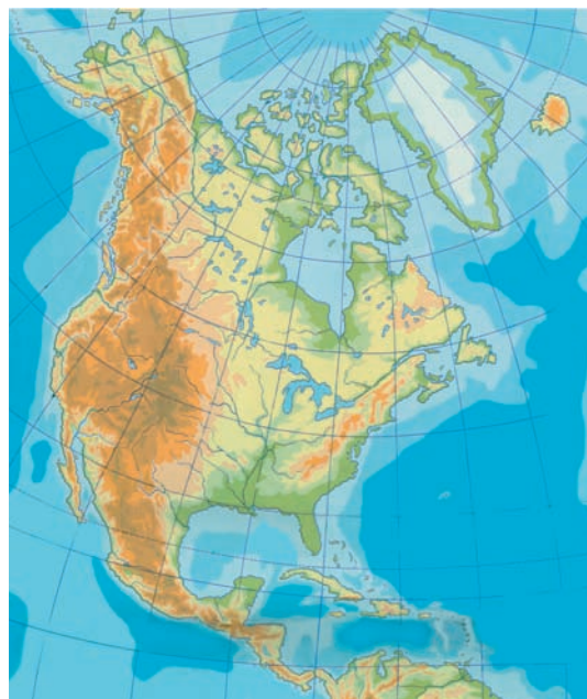
Εικόνα 39.1: Γεωμορφολογικός χάρτης της Β. Αμερικής

4. Στον ίδιο χάρτη σημείωσε τους μεγαλύτερους κόλπους της Βόρειας Αμερικής.