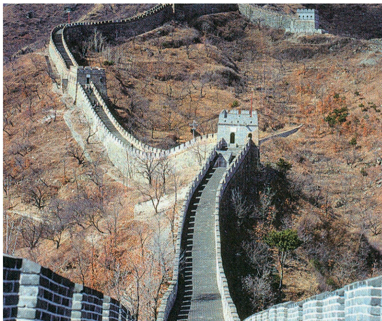
Εικόνα 35.1: Το Σινικό Τείχος

Τα κράτη της Κεντρικής Ασίας παρουσιάζουν μεγάλες διαφορές πολιτιστικές, εθνικές και φυλετικές. Το Καζακιστάν, το Ουζμπεκιστάν, το Τουρκμενιστάν, το Τατζικιστάν και το Κιργιστάν είναι κράτη που δημιουργήθηκαν μετά τη διάλυση της Σοβιετικής Ένωσης. Αντίθετα, η Κίνα είναι πανάρχαιο κράτος, που δημιούργησε δικό του πολιτισμό και σύστημα διακυβέρνησης. Οι καλές τέχνες στην Κίνα εμφανίστηκαν περίπου το 1500 μ.Χ.