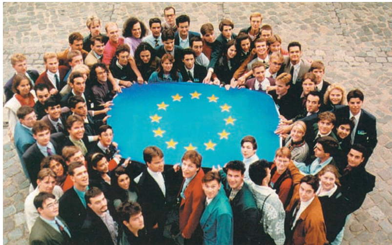
Εικόνα 33.3: Οι Ευρωπαίοι ενωμένοι

Ορισμένα κράτη-μέλη της Ε.Ε. (Αυστρία, Βέλγιο, Γαλλία, Γερμανία, Ιρλανδία, Ισπανία, Ιταλία, Λουξεμβούργο, Ολλανδία, Πορτογαλία, Φινλανδία και Ελλάδα) σήμερα ανήκουν στη λεγόμενη Ευρωζώνη, δηλαδή έχουν κοινό νόμισμα το ευρώ. Ας προβληματιστούμε για τα θετικά και τα τυχόν αρνητικά σημεία που απορρέουν από τη συμμετοχή της χώρας μας στην Ευρωζώνη.