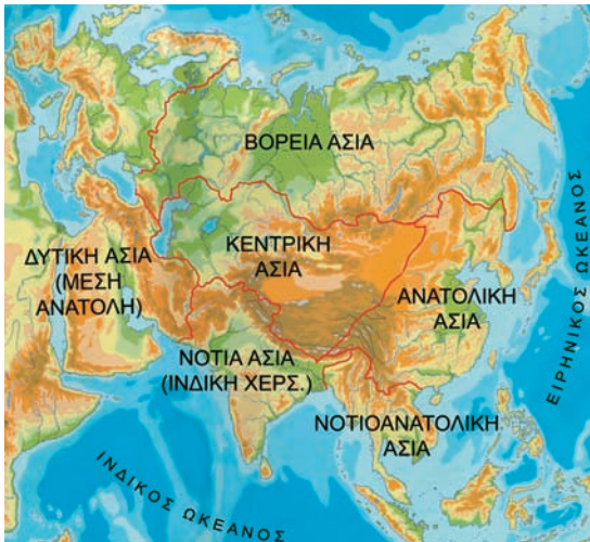
Εικόνα 34.2: Οι έξι περιοχές της Ασίας

Η ασιατική ήπειρος έχει μεγάλες σε έκταση και ύψος οροσειρές. Εδώ βρίσκονται τα Ιμαλάια, με υψηλότερη κορυφή το όρος Έβερεστ (8.848 μ.) και η οροσειρά Καρακορούμ-Κουέν Λουν. Ανάμεσα σε αυτούς τους δύο ορεινούς όγκους απλώνεται το οροπέδιο του Θιβέτ, ένα ξεχωριστό στοιχείο του ηπειρωτικού ανάγλυφου της Ασίας.