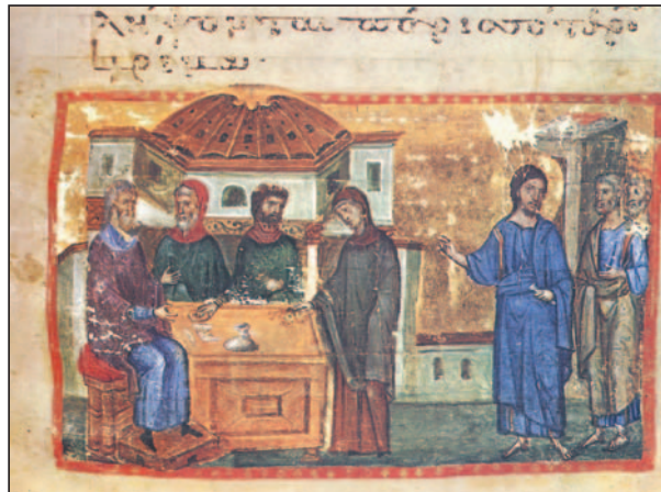
Ο Κύριος θαύμασε κι ευλόγησε τη διάθεση μιας φτωχής και χήρας γυναίκας, που πρόσφερε με την καρδιά της τα τελευταία δύο λεπτά που της είχαν απομείνει (χειρόγραφο από την Ι.Μ. Ιβήρων, Αγ. Όρος).