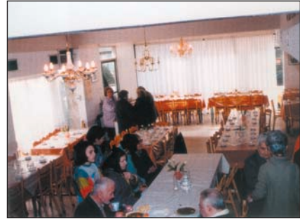
Προετοιμασία συσσιτίου σε γηροκομείο της Αρχιεπισκοπής Αθηνών.

Οι πρώτοι χριστιανοί, κάνοντας πράξη τη διδασκαλία του Χριστού, ζούσαν μαζί και είχαν τα πάντα κοινά. Όταν πουλούσαν τα κτήματα ή τα υπάρχοντά τους, μοιράζονταν μεταξύ τους τα χρήματα, ανάλογα με τις ανάγκες που είχε ο καθένας. Με απλότητα, μαζεύονταν σε ένα σπίτι κι εκεί τελούσαν τις Αγάπες , δηλαδή προσεύχονταν, κοινωνούσαν κι έτρωγαν όλοι μαζί. Έτσι, είχαν μεταξύ τους αγάπη, ομοψυχία κι ενότητα, γιατί αυτό που τους απασχολούσε, δεν ήταν πώς θα γίνουν πλουσιότεροι, αλλά το πώς θα νιώθουν και θα ζουν μεταξύ τους σαν αδέρφια.