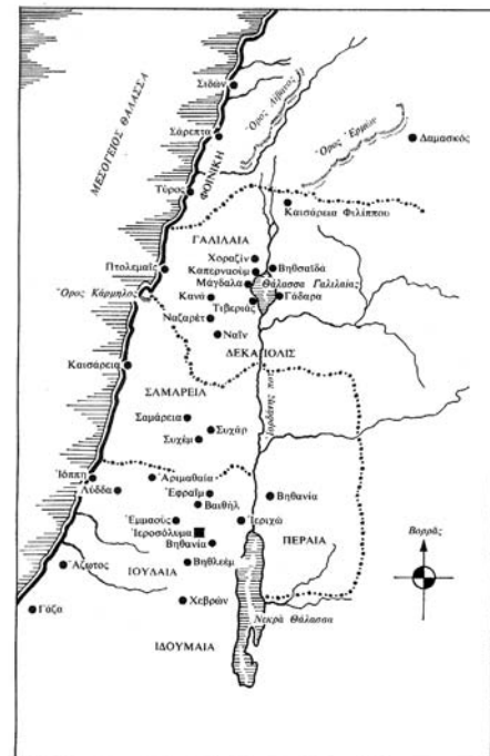
Η Παλαιστίνη στα χρόνια του Χριστού.

«Σήμερα», είπε ο δάσκαλος, «θα δούμε μια ιστορία που καταγράφει ο Ευαγγελιστής Μάρκος και στην οποία περιγράφεται ένα από τα θαύματα αυτά».