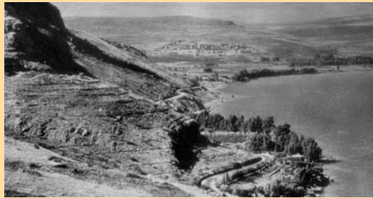
Γεννησαρέτ. Η λίμνη που έγινε το θαύμα.

Γ _ _ _ _ _ _ _ _ _ _ Ε _ _ _ _ _ _ _ _ _ _ Ρ _ _ _ _ _ _ _ _ _ _ Γ _ _ _ _ _ _ _ _ _ _ Ε _ _ _ _ _ _ _ _ _ _ Σ _ _ _ _ _ _ _ _ _ _ Α _ _ _ _ _