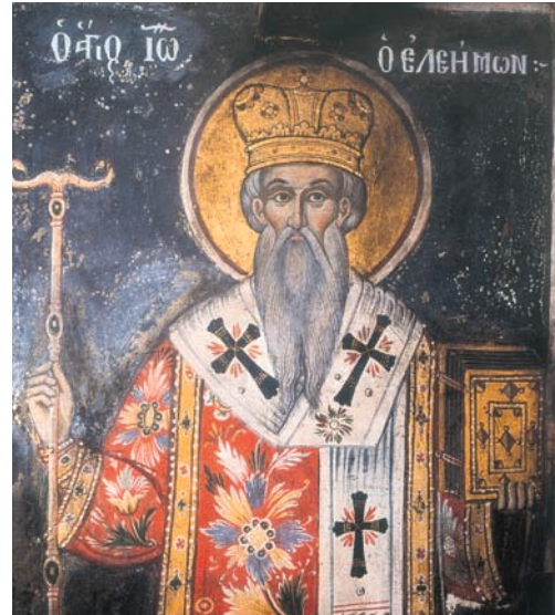
Ο Άγιος Ιωάννης ο Ελεήμων (τοιχογραφία από την Ι.Μ. Οσίου Γρηγορίου, Άγ. Όρος).

Από τη στιγμή εκείνη, ο Ελεήμονας Πατριάρχης, όπως ονομάστηκε, υπηρέτησε το Θεό και τους ανθρώπους, αφήνοντας πίσω του μόνο έργο αγάπης. Αντιμέτωπος με αυστηρότητα τους αιρετικούς της εποχής του, προφυλάσσουντας τους πιστούς από τις λανθασμένες και ανακριβείς διδασκαλίες τους. Έχτισε 63 Εκκλησίες, ξενοδοχεία, μαιευτήρια και νοσοκομεία, όπου επισκεπτόταν τακτικά. Ίδρυσε πτωχοκομεία και ειδικά ταμεία για τους φτωχούς της πόλης του (ήταν περίπου 7.500), προσφέροντάς τους όση βοήθεια χρειαζόνταν για να συντηρούνται.