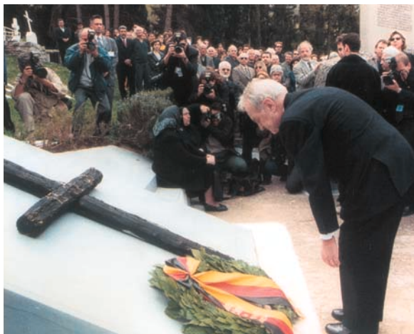
Ο πρόεδρος της Ομοσπονδιακής Δημοκρατίας της Γερμανίας κ. Γιόχανς Ράου ζητά επίσημα συγγνώμη, για την καταστροφή της πόλης των Καλαβρύτων από τους Γερμανούς στις 13 Δεκεμβρίου 1943 (Καλάβρυτα, Τρίτη 4 Απριλίου 2000).

Ο Πέτρος, όταν θυμήθηκε τα λόγια του Χριστού στο Μυστικό Δείπνο, κατάλαβε το