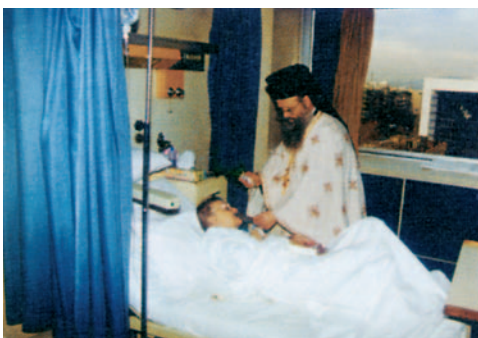
Η Εκκλησία, με τη βοήθεια όλων μας, φροντίζει όσους έχουν ανάγκη και βρίσκεται κοντά τους κάθε στιγμή.

Ο Άγιος Ιωάννης γεννήθηκε το 555 μ.Χ. στην Κύπρο. Ήταν ιδιαίτερα έξυπνος και μορφωμένος. Αφιέρωσε από νωρίς τη ζωή του στο Θεό που αγαπούσε βαθιά, μοιράζοντας όλη του την περιουσία στους φτωχούς. Ο λαός, αναγνωρίζοντας την καλοσύνη, την ευγένεια και την αγάπη του, ζήτησε από τον Αυτοκράτορα του Βυζαντίου Ηράκλειο να κάνει τον Ιωάννη Πατριάρχη της Αλεξάνδρειας. Ο Ιωάννης, αν και στην αρχή αρνήθηκε, τελικά δέχτηκε το θρόνο και χειροτονήθηκε το 610 μ.Χ.