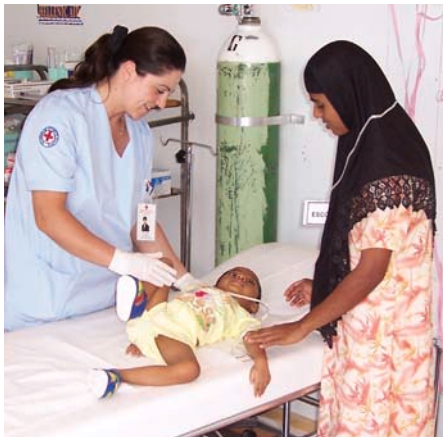
Ο Ελληνικός Ερυθρός Σταυρός προσφέρει πολύτιμες υπηρεσίες στους ανθρώπους που υποφέρουν.

Δεν υπάρχει πιο όμορφο πράγμα στη ζωή του χριστιανού από τη διακονία, τη φροντίδα δηλαδή, όσων έχουν ανάγκη. Λίγα λόγια αγάπης, ένα κομμάτι ψωμί, μια ζεστή χειρονομία, ένα χαμόγελο. Κι ο ίδιος ο Χριστός μας εξάλλου, όσο καιρό έμεινε μαζί με τους ανθρώπους, δεν έπαψε να διακονεί, να φροντίζει, να γιατρεύει το σώμα και την ψυχή όσων του το ζητούσαν με πίστη κι επιμονή. Αν κι εμείς αγαπάμε τον πλησίον μας, όπως και τον εαυτό μας, τότε αισθανόμαστε την ανάγκη να μοιραστούμε μαζί του ότι έχουμε και μπορούμε, από τα αγαθά που ο Θεός μας έχει χαρίσει. Κι ο Άγιος Ιωάννης αυτό έκανε. Η περιουσία του, όταν έκλεισε τα μάτια του για να ταξιδέψει κοντά στον Ελεήμονα Χριστό, ήταν μόνο τρία νομίσματα, τα οποία ζήτησε να δοθούν στους φτωχούς. Η μνήμη του γιορτάζεται στις 12 Νοεμβρίου.