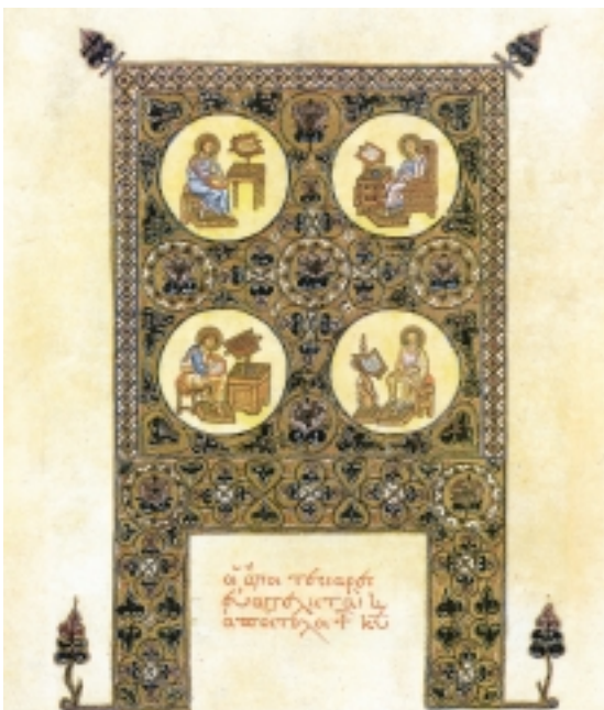
Εικ. 7 η : Οι τέσσερις Ευαγγελιστές, Γ. Γρηγοριάδου-Σουρέλη, Η Ζωή του Χριστού, (εικονογράφηση Π. Βαμπούλη).

4. Μελετήστε το παράθεμα του μαθήματος σχετικά με την πρώτη χριστιανική κοινότητα. Ποια στοιχεία μας δίνει για τη ζωή των χριστιανών; Εντοπίζετε κάποιες ομοιότητες ή διαφορές με την οργάνωση των ενοριών της Εκκλησίας στις μέρες μας;