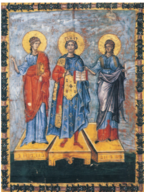
Εικ. 9 η : Ο βασιλιάς Δαβίδ ανάμεσα στη Σοφία και την Προφητεία, Μικρογραφία από Ψαλτήριο, περίπου 1300 μ.Χ., Biblioteca Apostolica Vaticana, Βατικανό.

4. Η εκκλησιαστική υμνογραφία και ποίηση θα γνωρίσει ακόμα μεγαλύτερη άνθηση με τα κοντάκια* και τους κανόνες*, που συνδέθηκαν με τις λατρευτικές ανάγκες της Εκκλησίας. Να βρείτε περισσότερες πληροφορίες γι' αυτά τα είδη της θρησκευτικής ποίησης και να καταγράψετε κάποιους στίχους από τους ύμνους που χρησιμοποιούνται στη λατρεία μας.