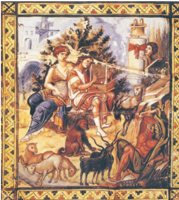
Εικ. 8 η : Ο Ψαλμωδός Δαβίδ, Μικρογραφία από Ψαλτήριο του 10ου αι. μ.Χ., Bibliothèque Nationale, Παρίσι.

Το βιβλίο στο οποίο περιέχονται οι 150 Ψαλμοί ονομάζεται Ψαλτήρι και είναι ένα από τα σημαντικότερα λειτουργικά βιβλία της Εκκλησίας μας. Οι Ψαλμοί διαβάζονται συνήθως στην αρχή των ιερών ακολουθιών της Εκκλησίας μας, ενώ στίχοι τους χρησιμοποιούνται και στη Θεία Λειτουργία, που είναι το κέντρο της ορθόδο-