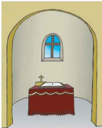
Το Ευαγγέλιο τοποθετημένο στην Αγία Τράπεζα.

Το ιερό Ευαγγέλιο στα μυστήρια της Εκκλησίας