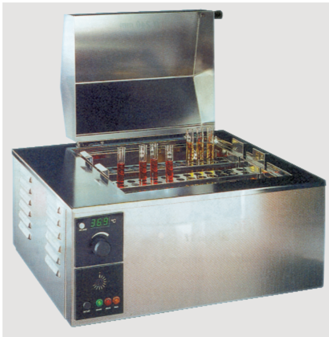
Σχήμα 4.1. Υδατόλουτρο με ψηφιακή ένδειξη της θερμοκρασίας και καπάκι.

Υπάρχουν και υδατόλουτρα που αναπτύσσουν μεγάλη θερμοκρασία, συνήθως δεν έχουν νερό αλλά μια μεταλλική θήκη, στην οποία εφαρμόζονται τα σκεύη που περιέχουν το διάλυμα. Χρησιμοποιούνται για την εξάτμιση διαλυμάτων, όταν μας ενδιαφέρει η διαλυμένη ουσία.