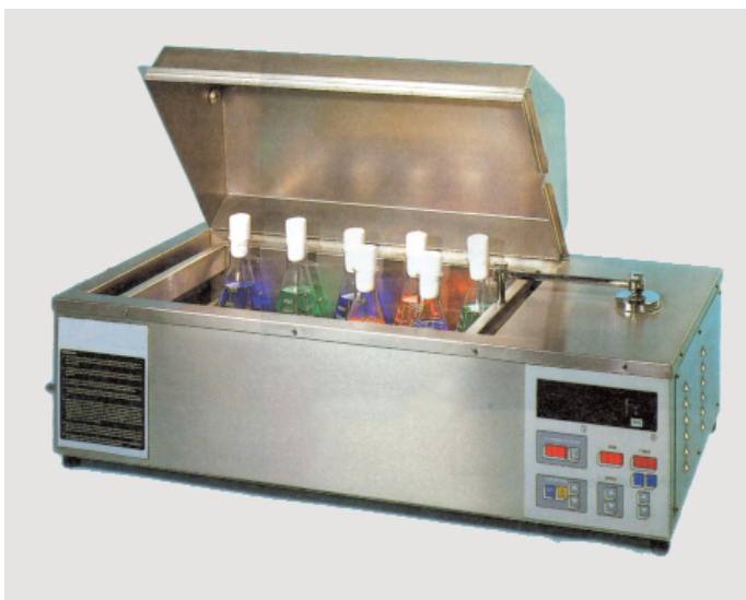
Σχήμα 4.2. Υδατόλουτρο με ανακινητήρα για την ανάδευση των φιαλών με καπάκι