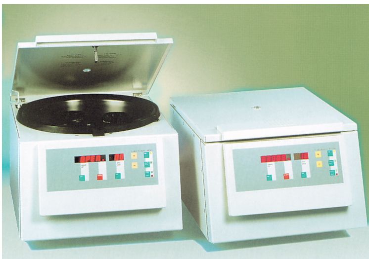
Σχήμα 6.1. Μια τυπική εργαστηριακή επιτραπέζια φυγόκεντρος

Η φυγοκέντριση είναι μια από τις πιο χρήσιμες εφαρμογές της κυκλικής κίνησης στην πράξη. Η αρχή της μεθόδου βασίζεται στη φυγόκεντρο δύναμη που αναπτύσσεται σε οποιοδήποτε σωματίδιο κινείται σε κυκλική τροχιά με σταθερή γωνιακή ταχύτητα.