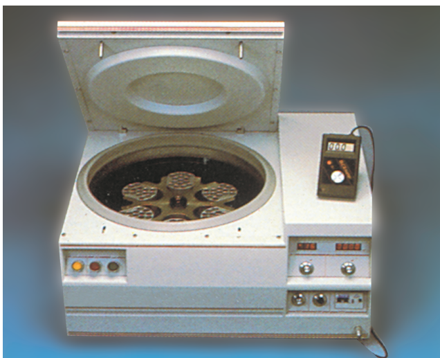
Σχήμα 6.4. Η ψυκτική φυγόκεντρος