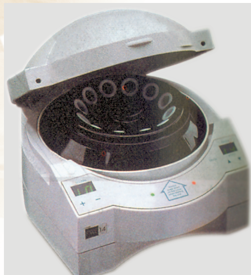
Σχήμα 6.5. Η μικροφυγόκεντρος