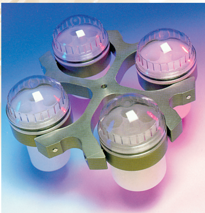
Σχήμα 6.3. Η οριζόντια κεφαλή

(σωματίδια) από το υγρό. Το μέγεθος της δύναμης που απαιτείται για να διατηρηθεί ένα σωματίδιο σε κυκλική κίνηση σταθερής ακτίνας και ταχύτητας εξαρτάται από τη μάζα του. Για το λόγο αυτό, τα βαρύτερα σωματίδια απομακρύνονται από το κέντρο περιστροφής, ενώ τα ελαφρότερα παραμένουν πιο κοντά σε αυτό. Στις συσκευές φυγοκέντρισης εύκολα επιτυγχάνονται δυνάμεις μεγαλύτερες από τη βαρύτητα.