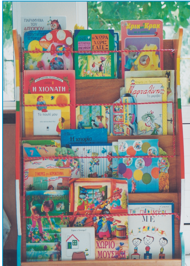
Εικ. 2. Στις μέρες μας έχουμε πλούσια παραγωγή λογοτεχνικών βιβλίων για παιδιά.

Πέρα όμως από την Ελλάδα και, χρονικά, κυρίως μετά τη βιομηχανική επανάσταση, η Παιδική Λογοτεχνία γνωρίζει ιδιαίτερη άνθηση τόσο στην Ευρώπη και την Αμερική όσο και στον υπόλοιπο κόσμο. Σημαντική θέση σε παγκόσμιο επίπεδο κατέχουν ο Γάλλος Ιούλιος Βερν (Jules Vern) με έργα επιστημονικής φαντασίας για παιδιά άνω των δώδεκα ετών, ο Δανός Χανς Κρίστιαν Άντερσεν (Hans Christian Andersen) που με τα παραμύθια του συγκίνησε μικρούς και μεγάλους καθώς και ο Αμερικανός Μαρκ Τουέιν (Mark Twain), που με τα γεμάτα ρεαλισμό και χιούμορ έργα του υπήρξε ένας από τους πρωτοπόρους της αμερικανικής Παιδικής Λογοτεχνίας.