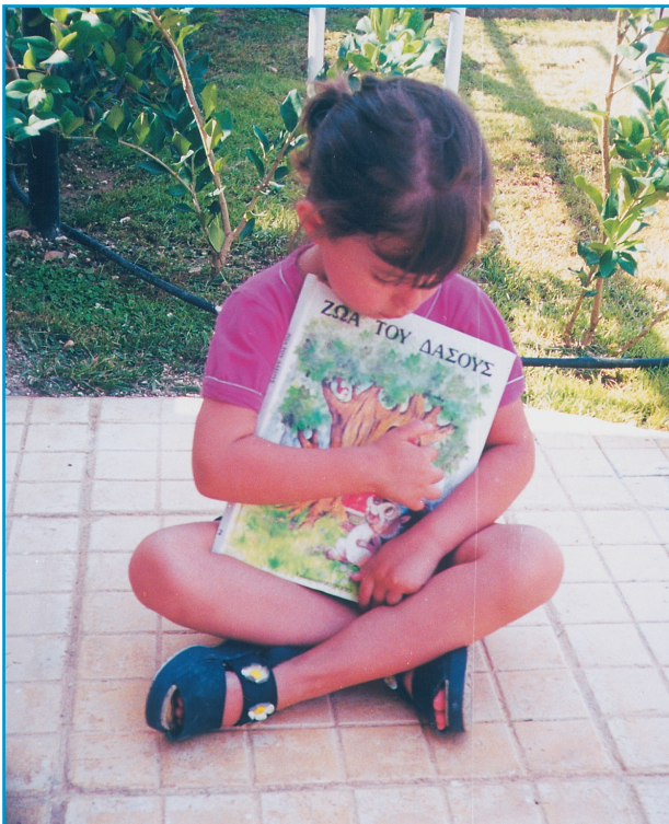
Εικ. 10. Το μικρό παιδί απολαμβάνει μια κτητική σχέση με το εικονογραφημένο βιβλίο.

Την ιδιαίτερη και προνομιακή του θέση θα την αντιληφθούμε καλύτερα, αν προσδιορίσουμε με σαφήνεια την προσφορά και τη σημασία του. Πρώτα και πάνω απ' όλα, το μικρό παιδί απολαμβάνει μια κτητική σχέση με το εικονογραφημένο βιβλίο (βλ. Εικ. 10). Αισθάνεται ότι, ως δική του περιουσία, μπορεί να το χειρίζεται όποτε και όπως θέλει. Δεν μπορεί να του το στερήσει κανείς. Έτσι, αυτό που του προσφέρεται μέσα από την εικονογράφιση δεν είναι παροδικό και φευγαλέο, αλλά μόνιμο και σταθερό.