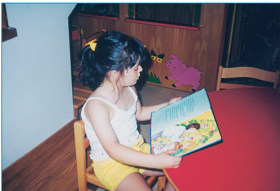
Εικ. 14. Εικόνα και λόγος στο εικονογραφημένο βιβλίο.

Από όλα όσα είπαμε παραπάνω γίνεται φανερό ότι για την επιλογή των κατάλληλων εικονογραφημένων βιβλίων χρειάζεται μεγάλη προσοχή, ιδιαίτερα μάλιστα, αν λάβουμε υπόψη μας ότι οι αναγνώστες τους δε συμμετέχουν σ' αυτή τη διαδικασία και η γνώμη τους ή παίζει δευτερεύοντα ρόλο ή αγνοείται παντελώς λόγω των ιδιαιτεροτήτων της ηλικίας τους.