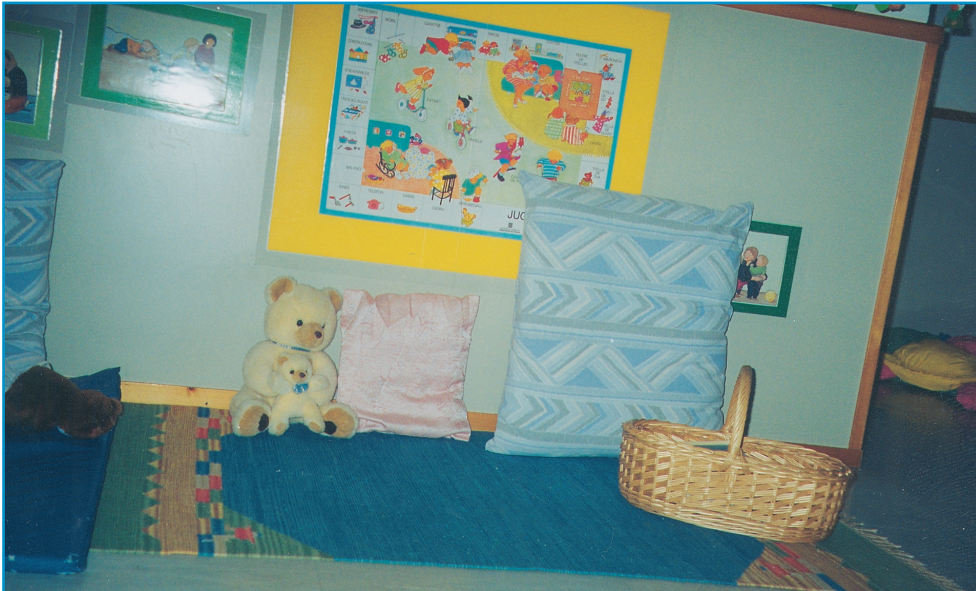
Εικ. 13. Βρεφική γωνιά βιβλιοθήκης.