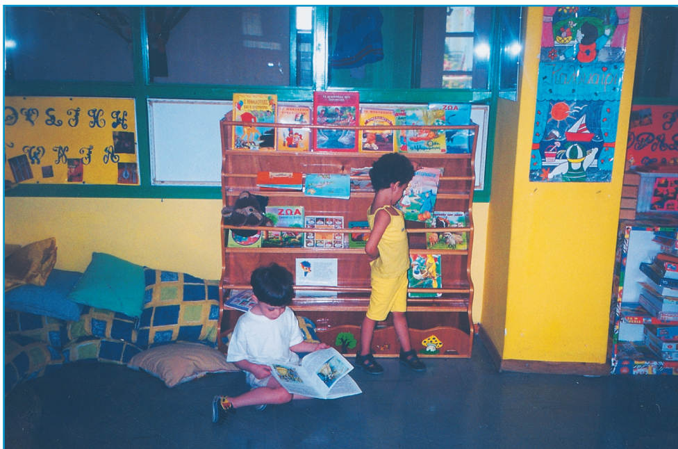
Εικ. 5. Η άμεση επαφή με το βιβλίο είναι επιβεβλημένη στους χώρους προσχολικής αγωγής.

Οι επισκέψεις των παιδιών σε εκθέσεις βιβλίου, παρ' όλο που συνήθως είναι ολιγόωρες, προσφέρουν κέρδος, γιατί τους δίνουν τη δυνατότητα να δουν και να ξεφυλλίσουν τα βιβλία και τελικά να αγοράσουν κάποιο ή κάποια. Αν και αυτό συμβαίνει τυχαία στη ζωή τους, εντούτοις μπορεί να τους ανοίξει το δρόμο προς το διάβασμα.