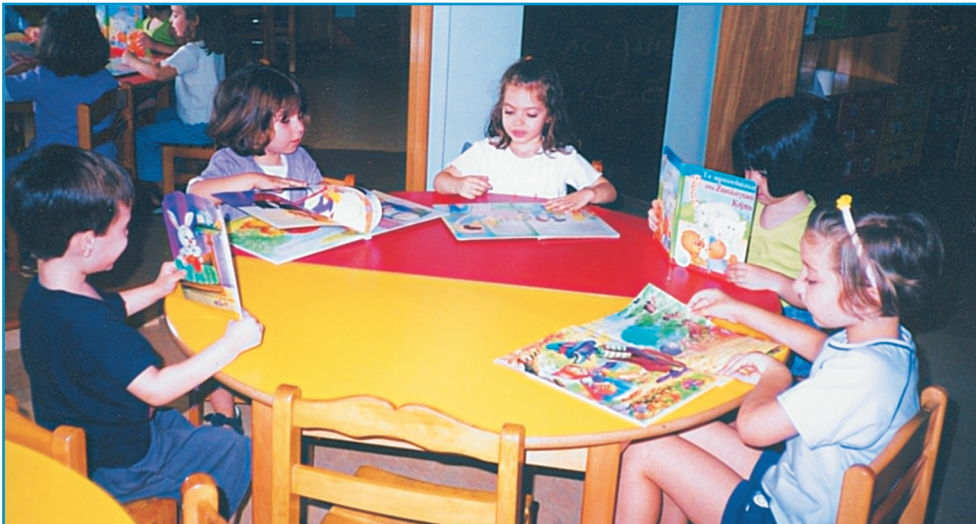
Εικ. 6. Το φυσικό περιβάλλον στο παιδικό λογοτεχνικό βιβλίο.

Τέλος, θα ήταν παράλειψη να μην αναφέρουμε ότι το παιδικό βιβλίο σήμερα δεν έχει εγκαταλείψει τις νεράιδες, τα βασιλόπουλα και τα άλλα στοιχεία που έχουμε γνωρίσει στο παρελθόν. Έχει αλλάξει μόνον ο τρόπος που ενεργούν οι ήρωες, όπως άλλαξαν και οι ιδέες που αυτοί εκφράζουν. Δηλαδή, οι συγγραφείς εφαρμόζουν αυτό που πολλές φορές έχει ειπωθεί για τη Λογοτεχνία: «Σημασία δεν έχει τι θα πεις, αλλά πώς θα το πεις» ή, αλλιώς, «Όλα μπορείς να τα πεις, αρκεί να τα πεις με τον κατάλληλο τρόπο».