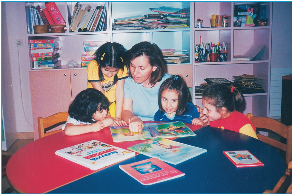
Εικ. 3. «Ο δάσκαλος ανάμεσα στο παιδί και στο βιβλίο»

Εύκολα, λοιπόν, κατανοεί κάποιος πόσο σημαντικός είναι ο ρόλος του/της παιδαγωγού-δασκάλου/-ας στην προσέγγιση της Λογοτεχνίας από το παιδί.