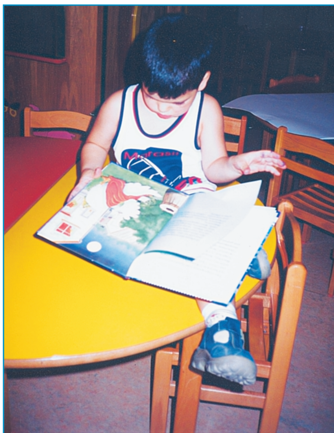
Εικ. 8. Η προσεγγμένη εικονογράφηση του βιβλίου βοηθάει στην αισθητική καλλιέργεια του παιδιού.