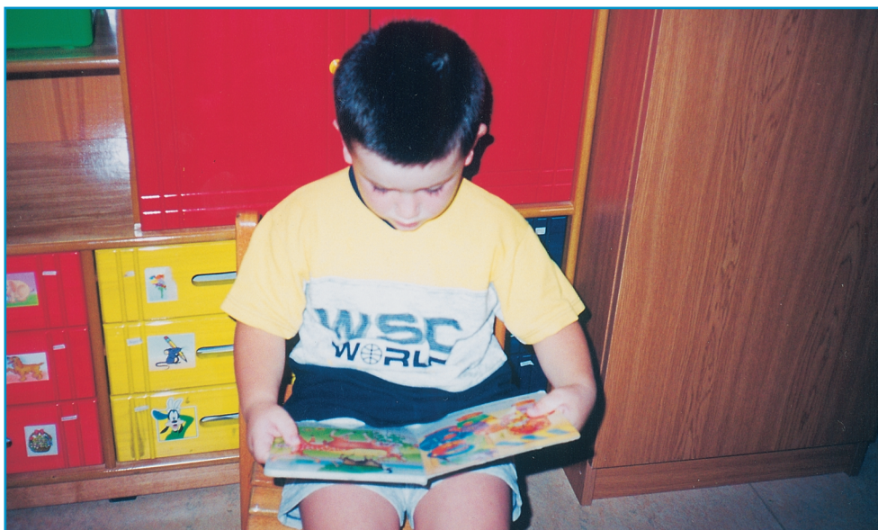
Εικ. 9. Το παιδί «διαβάζει» τις εικόνες.

Εικονογραφημένο βιβλίο για την προσχολική ηλικία είναι εκείνο «που το περιεχόμενό του εκφέρεται ενσυνείδητα είτε αποκλειστικά μέσω των εικόνων του είτε με τη συνδρομή του λόγου σε ισορροπημένη και λειτουργικά εναρμονισμένη αναλογία – οργανική σύνδεση γλωσσικού και εικαστικού κώδικα.» 14