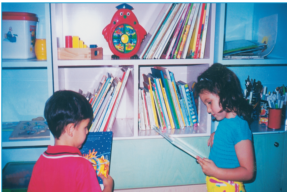
Εικ. 4. Οι χώροι της προσχολικής αγωγής συμβάλλουν στην επαφή του παιδιού με το βιβλίο.

Οι χώροι Προσχολικής Αγωγής συμβάλλουν στην οριστική σύνδεση του παιδιού με το βιβλίο. Γί' αυτό το λόγο δεν πρέπει να απουσιάζουν από αυτούς τα βιβλία, η γωνιά βιβλιοθήκης και οι δραστηριότητες που σχετίζονται με τη λογοτεχνία.