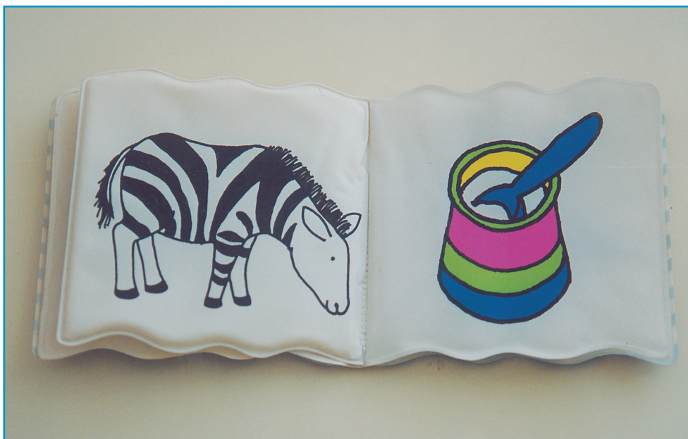
Εικ. 12. Το πρώτο βιβλίο του παιδιού.

σελίδα να υπάρχει μία μόνο εικόνα, το κείμενο να είναι υποτυπώδες και το υλικό κατασκευής τους τέτοιο, ώστε να αντέχει στην έντονη χρήση. (Βλ. Εικ. 12).