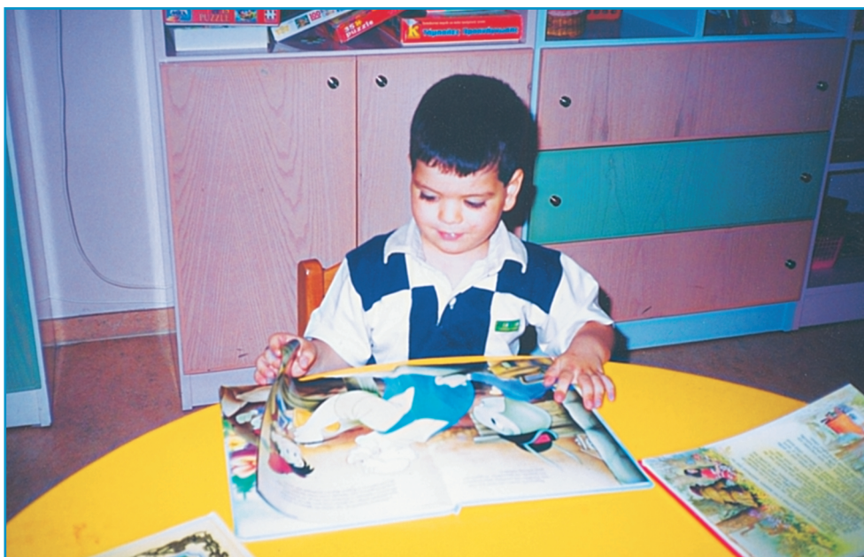
Εικ. 1. Η χαρά της «ανάγνωσης» ζωγραφισμένη στο πρόσωπο του παιδιού.