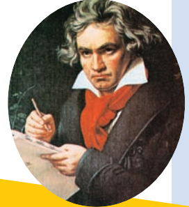
Λούντβιχ βαν Μπετόβεν