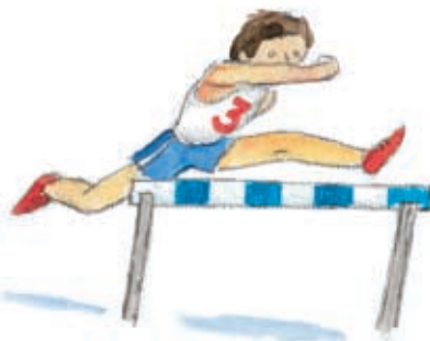
δρόμος μετ' εμποδίων