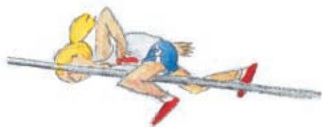
άλμα σε ύψος