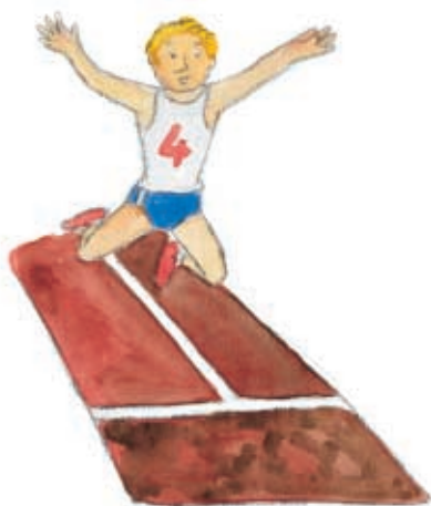
άλμα σε μήκος