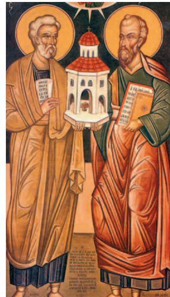
Οι Απόστολοι Πέτρος και Παύλος εικονίζονται μαζί, κρατώντας την Εκκλησία του Χριστού, που ίδρυσαν και στήριξαν με το έργο και τη ζωή τους (φορητή εικόνα Φ. Κόντογλου, Μονή Μεταμορφώσεως, Βοστώνη 1955).

Συζητούμε για τον τρόπο με τον οποίο παρουσιάζει ο Απόστολος Πέτρος στο τρίτο κείμενο των παραθεμάτων τις αρετές που πρέπει να κατακτήσει με τον αγώνα του ο χριστιανός. Ποια τοποθετεί τελευταία; Γιατί;