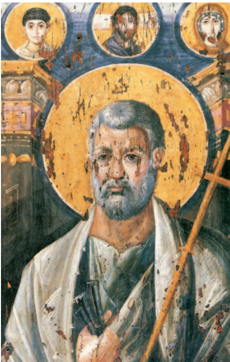
Ο Άγιος Πέτρος (Ι. Μ. Αγ. Αικατερίνης, Σινά, 6ος αιώνας).