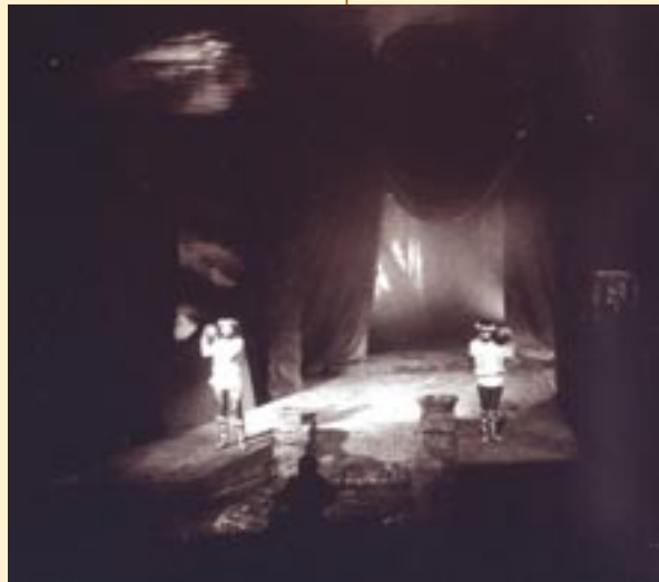
Διόσκουροι (Σ. Κατραμάδας – Τ. Πανταζής, Κ.Θ.Β.Ε., 1982, σκην. Α. Βουτσινάς)