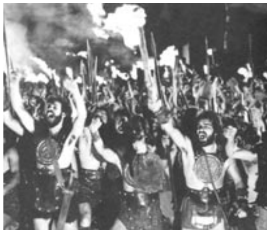
Ιφιγένεια (κινηματογραφική ταινία, σκην. Μ. Κακογιάννης)