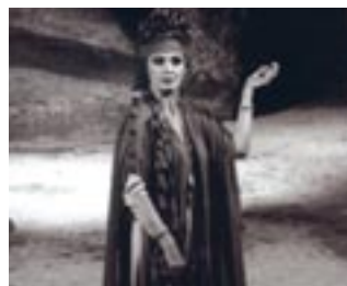
Ελένη (Α. Λαδικού, Κ.Θ.Β.Ε., 1982, σκην. Α. Βουτσινάς)