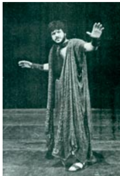
Β' Αγγελιαφόρος (Γ. Παρσαλάκης, Ευριπίδης, Φοίνισσες, Εθνικό Θέατρο, 1980, σκην. Α. Μινωτίς)