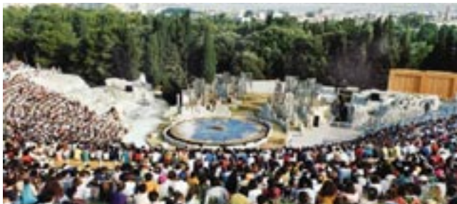
Η παράσταση τελειώνει