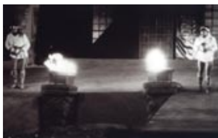
Διόσκουροι (Ζ. Κατραμάδας – Τ. Παναζής, Κ.Θ.Β.Ε., 1982, σκην. Α. Βουσιανός)

■ Ο «από μηχανής θεός» συνήθως εμφανίζεται όταν η δράση φτάνει σε αδιέξοδο, για να λύσει τους δραματικούς κόμπους με το μαγικό του ραβδί.