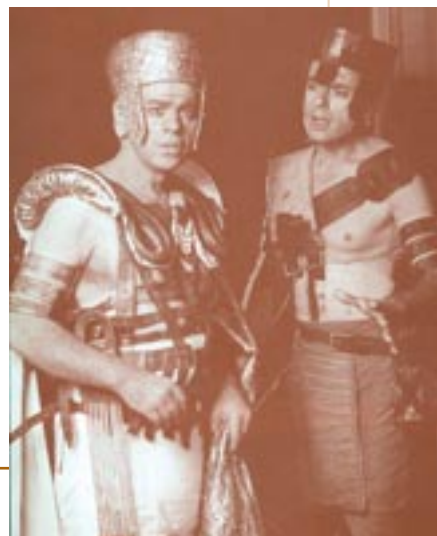
Θεοκλύμενος – Αιγύπτιος Αγγελιαφόρος (Σ. Μαβίδης – Γ. Κρονήρης, Αμφιθέατρο, 1999, σκην. Σ. Ευαγγελιάτος)