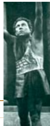
Αιγύπτιος Αγγελιαφόρος (Σ. Βόκοβιτς, Εθνικό Θέατρο, 1977, σκην. Α. Σολομάς)