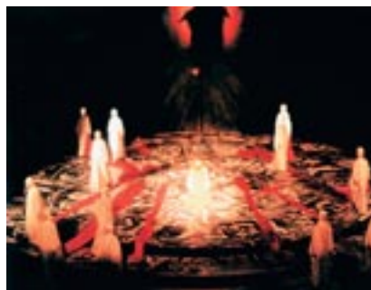
Ευριπίδης, Μήδεια (Θ.Ο.Κ., 1984, σκην. Μ. Βολανάκης)