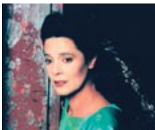
Ελένη (Λ. Τασσπούλου, Αμφιθέατρο, 1999, σκην. Σ. Ευαγγελιάτος)