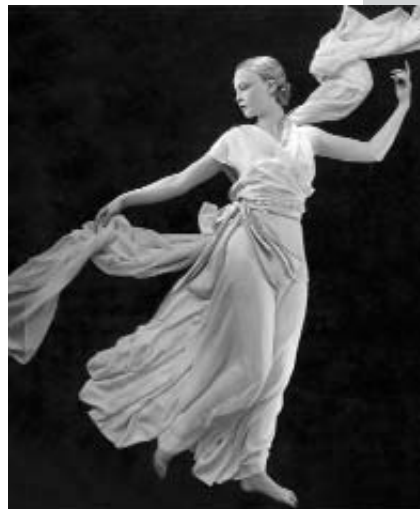
MADELEINE VIONNET Μεταξωτό κρεπ φόρεμα του 1931.