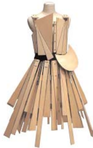
YOSHI YAMAMOTO Σύνολο από τη φθινοπωρινή κολεξιόν του 1991.