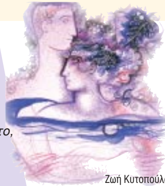
Ζωή Κυτοπούλου, Αγάπη, Λεξικό Ελλήνων Καλλιτεχνών, εκδ. Μέλισσα, 1998

Ημερολόγιο 2005, Μαρία Πολυδούρη, επιμ. Χριστίνα Ντουσιά, εκδ. Μεταίχμιο, 2005