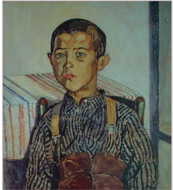
Σπύρος Παπαλουκάς, Αγόρι με τσιράντες

Το χρονικό του Παναγή Σκουζέ (1777-1847) γράφτηκε στις αρχές της δεκαετίας του 1840 και ιστορεί τα πάθη του ίδιου, της οικογένειάς του, αλλά και των άλλων Αθηναίων, την περίοδο που τυραννούσε την πόλη ο χατζη-Αλής Χασεκής, από το 1772 ως το 1796. Η επιδημία της πανούκλας, ο ξαφνικός θάνατος της μάνας του και η πτώχευση του πατέρα του έκαναν τον εντεκάχρονο Παναγή να διακόψει οριστικά τις σπουδές του, να βρεθεί κρατούμενος στη φυλακή (όμηρος στη θέση του πατέρα του) και, στη συνέχεια, να γίνει για ένα διάστημα υπηρέτης. Συγγενής του Μακρυγιάννη, από τον οποίο ενδεχομένως εμπνεύστηκε και το δικό του αυτοβιογραφικό έργο, ο Σκουζές καταθέτει τη μαρτυρία του με ανέραιο ήθος, εκφραστική λιπότητα και περιγραφική ακρίβεια.