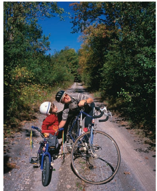
Εικ. 1.1 Η οικογένεια είναι το πρώτο σχολείο της ζωής

Σκοπός της οικογένειας είναι η δημιουργία ενός υγιούς και ηθικού περιβάλλοντος, όπου θα ζήσουν ευτυχισμένα όλα τα μέλη της. Τα παιδιά θα αναπτυχθούν σωματικά και πνευματικά, θα καλλιεργηθούν ψυχικά, θα διαμορφώσουν προσωπικότητα και θα γίνουν ικανά να ενταχθούν στην ευρύτερη κοινωνία.