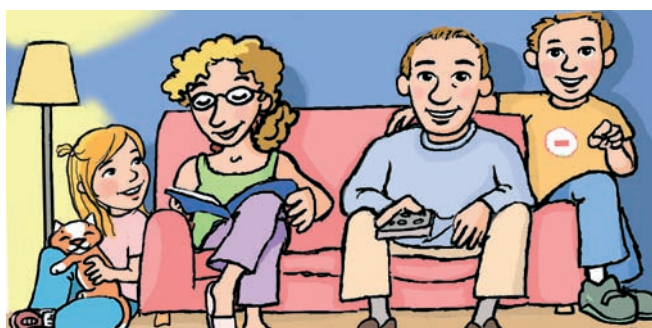
Εικ. 1.2 Η πυρηνική οικογένεια αποτελεί την κύρια μορφή οικογένειας