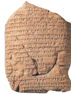
Πήλινη πλάκα του 6ου π.Χ. αι., (μέρος του χρονικού της Βαβυλώνας).

Όλες οι πτυχές της ιστορίας έχουν κάποια γενεσιουργά αίτια. Όταν ο ιστορικός τα εντοπίσει, καλείται να καταγράψει τις αφορμές των γεγονότων. Η αφορμή είναι ο σπινθήρας που πυροδοτεί τα αίτια και η διερεύνησή της είναι ευκολότερη από αυτή των αιτίων. Αίτια και αφορμές, λοιπόν, των ιστορικών γεγονότων αποτελούν τη βάση για την έρευνα της ιστορίας.