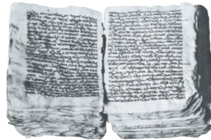
Συριακός κώδικας με την αρχαιότερη μετάφραση του Ευαγγελίου. Αρχές 5ου αι. Βιβλιοθήκη Ι.Μ. Σινά.

Σκοπός του έργου του Χριστού είναι η σωτηρία του ανθρώπου. Το έργο αυτό συνεχίζεται με την ίδρυση της Εκκλησίας, για την οποία φρόντισε ο Ίδιος, όπως θα διδαχθούμε σε επόμενη ενότητα. Ο σκοπός της Εκκλησίας, επομένως, είναι η προσωπική συνάντηση και η ένωση του κάθε βαπτισμένου με τον Χριστό.