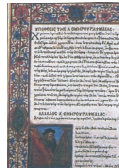
Πρώτη έκδοση του Ομήρου, Φλωρεντία 1505 αι.

Είναι, επίσης, σαφές ότι δεν μπορεί να γραφεί αντικειμενική και αμερόληπτη ιστορία, όταν ο ιστορικός με τη συγγραφή του υπηρετεί ιδεολογικές και πολιτικές σκοπιμότητες.