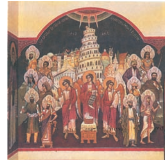
Ο Πύργος της Βαβέλ, Τράπεζα Ιεράς Μονής Παρακλήτου, Ωρωπός Αττικής. Τα έθνη διασκορπίζονται μετά το γεγονός του Πύργου της Βαβέλ, το καθένα έχοντας τη δική του γλώσσα και συνοδευόμενο από έναν άγγελο.

Το Άγιο Πνεύμα από εκείνη τη μέρα, όπως ο ίδιος ο Χριστός είχε υποσχεθεί στους μαθητές του, καθοδηγεί την Εκκλησία και δίνει τη δυνατότητα στους ανθρώπους να γνωρίσουν την αλήθεια. Και αυτή η αλήθεια είναι ο Χριστός και ο νέος τρόπος ζωής που προτείνει στους ανθρώπους. Η γνώση αυτής της αλήθειας απελευθερώνει τους ανθρώπους από κάθε είδους δεσμά («όπου υπάρχει το Πνεύμα του Κυρίου, εκεί υπάρχει και ελευθερία», Β' Κορ. 3,17 ). Ο αναστημένος Χριστός νίκησε το θάνατο, όχι μόνο ως Θεός αλλά και ως άνθρωπος. Αυτό δίνει τη βεβαιότητα στον πιστό άνθρωπο ότι ο θάνατος δεν είναι το τέλος της ζωής που συντρίβει τις ελπίδες του και τον χωρίζει από τα αγαπημένα του πρόσωπα. Η Ανάσταση δίνει τη βεβαιότητα ότι θα ζήσουμε όλοι μαζί και με τον Χριστό και ότι ο θάνατος δε θα μας χωρίζει πια.