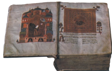
Περγαμηνή του 11ου αι. Ι.Μ. Σινά.