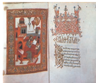
Ευαγγέλιο χειρόγραφο του 15ου αι. Ι. Μ. Σινά.

Όπως αναφέραμε στην προηγούμενη διδακτική ενότητα, η σωστή καταγραφή και μελέτη των πηγών της ιστορίας απαιτεί αντικειμενικότητα και αμεροληψία. Τα δύο αυτά στοιχεία είναι απαραίτητα και για τη σωστή μελέτη των πηγών της εκκλησιαστικής ιστορίας. Κι αυτό μπορεί να επιτευχθεί και με τη βοήθεια της αυτοκριτικής. Δηλαδή, εξετάζοντας την εκκλησιαστική ιστορία σε Δύση και Ανατολή, δε θα πρέπει να αποσιωπούνται «μελανές σελίδες» που οφείλονται στις ανθρώπινες αδυναμίες και στα πάθη.