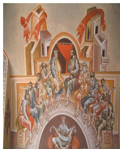
Η επιφάνιση του Αγίου Πνεύματος (Άγιος Γεώργιος Βηρυττού, τον Γ. Κόρδη). Ενδιαφέρον έχει η μορφή που εικονίζεται στο κάτω μέρος της εικόνας, και παριστάνει τον Κόσμο προσωποποιημένο, δείχνοντας έτσι ότι το γεγονός της Πεντηκοστής έχει κεντρική σημασία για τον αγιασμό όλου του κόσμου.

Στο απορημένο πλήθος των συγκεντρωμένων ανέλαβε να μιλήσει ο Απόστολος Πέτρος. Τους θύμισε τα όσα είχε πει ο Θεός στους Ισραηλίτες μέσω του προφήτη Ιωήλ: «...στις έσχατες ημέρες ... θα χαρίσω πλουσιοπάροχα το Πνεύμα μου σε κάθε άνθρωπο. Έτσι, οι γιοι σας και οι θυγατέρες σας θα κηρύξουν την αλήθεια...» ( Πράξ. 2,14 κ. εξ.). Μετά τους μίλησε για τον Ιησού, τον οποίο, ενώ εκείνοι σταύρωσαν, ο Θεός Τον ανέστησε. Οι ίδιοι οι