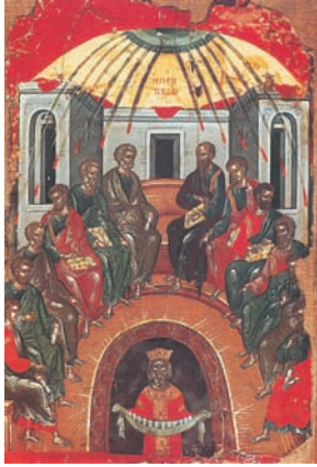
Πεντηκοστή Θεοφάνη του Κρητός, 16ος αι., Αγιον Όρος, Ιερά Μονή Σταυρονικήτα.

μαθητές ήταν μάρτυρες αυτής της αλήθειας (2,32). Στο τέλος κάλεσε όλους τους συγκεντρωμένους να μετανοήσουν και να βαπτιστούν στο όνομα του Χριστού, για να συγχωρηθούν οι αμαρτίες τους και να πάρουν τα χαρίσματα του Αγίου Πνεύματος.