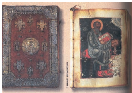
Κώδικες 11ου αι. Μονή Μεγάλου Μετεώρου.

Τα είδη των κειμένων, ως πηγές της εκκλησιαστικής ιστορίας, είναι πολλά: οι χρονογραφίες, τα έργα των εκκλησιαστικών συγγραφέων και των Πατέρων της Εκκλησίας, τα πρακτικά των Οικουμενικών Συνόδων, τα λατρευτικά κείμενα, επιστολές, κείμενα με βίους αγίων, καθώς και διάφορες νομοθεσίες της πολιτείας σχετικές με την Εκκλησία.