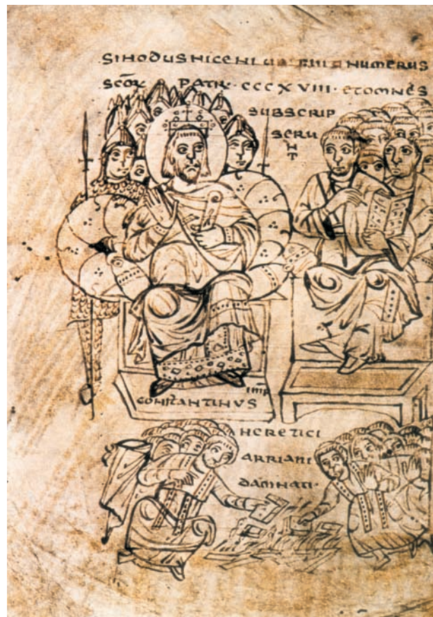
Ο Μ. Αθανάσιος παρακολούθησε την Α' Οικουμενική Σύνοδο ως διάκονος – γραμματέας του επισκόπου Αλεξανδρείας Αλέξανδρου.

Ο Μ. Αθανάσιος έζησε σε μια εποχή, κατά την οποία η Εκκλησία κινδύνευε να χάσει την ταυτότητά της από την αίρεση του Αρείου. Ο Μ. Αθανάσιος αντέδρασε στην αίρεση αυτή χάρη στη φώτιση του Αγίου Πνεύματος και με εφόδια τη γνώση της Αγίας Γραφής και της Παράδοσης της Εκκλησίας. Τόνιζε ότι ο Υιός του Θεού προσέλαβε τη φθαρτή ανθρώπινη φύση και έγινε άνθρωπος, για να λυτρώσει το ανθρώπινο γένος από την αμαρτία, η οποία προήλθε από την πώση των πρωτοπλάστων. Ο Χριστός, επομένως, είναι Αυτός που διασφαλίζει τη σωτηρία των ανθρώπων, αφού είναι και άνθρωπος – εκπρόσωπος του ανθρώπινου γένους – και Θεός – Υιός του Θεού και Πρόσωπο της Αγίας Τριάδας.