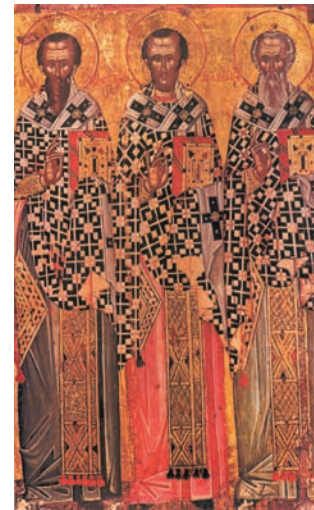
Τρεις Ιεράρχες (από αριστερά, Μέγας Βασίλειος, Ιωάννης Χρυσόστομος, Γρηγόριος Θεολόγος). 16ος αι. Αρχαιολογικό Μουσείο Τιράνων, Αλβανία.

Ο Μ. Βασίλειος οργάνωσε και το μοναχικό βίο. Έβλεπε στη μοναστική ζωή να συμπυκνώνονται οι αρχές της αληθινής χριστιανικής ζωής. Η ενότητα των μοναχών και η σύμπνοια που πρέπει να τους διακατέχει (κείμενο Ασκητικών Διατάξεων «τελειότατη κοινωνία... πολλούς») προβλήθηκαν από τον Μ. Βασίλειο και για την κοινωνική ζωή των χριστιανών στις πόλεις.