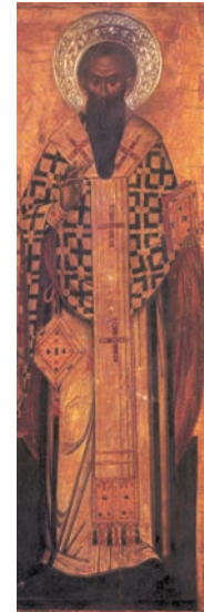
Μ. Βασίλειος Μονή Ζωοδόχου Πηγής, Πάτμος 17ος αι.

(Είς το «καθελώ μου τας αποθήκας», Β.Ε.Π.Ε.Σ. τόμ. 54, εκδ. Απ. Διακονίας, Αθήνα 1976, σελ. 64-65, 7-8).