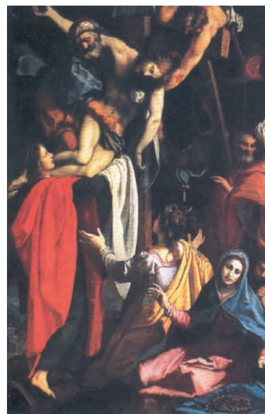
Αποκαθήλωση του Cigoli. Παλάτι Pitti, Φλωρεντία, 17ος αι.