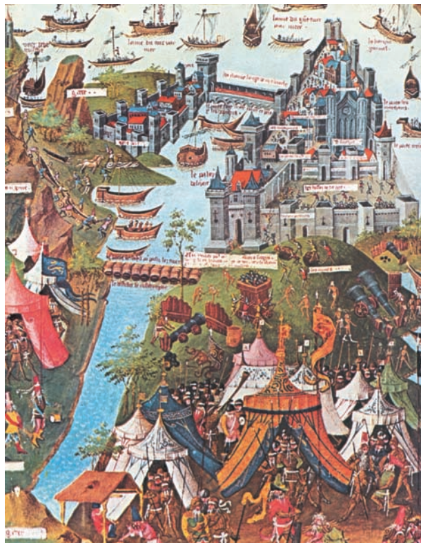
Η πολιορκία της Κωνσταντινούπολης. Γαλλικό χειρόγραφο του 15ου αιώνα.

Τα προνόμια όμως αυτά πρωταρχικά εξυπηρετούσαν τα οθωμανικά συμφέροντα, γιατί έδιναν το δικαίωμα στο Σουλτάνο να κατηγορήσει τον Πατριάρχη, όταν οι χριστιανοί ήταν απείθαργοι. Γι' αυτό και τα προνόμια καταπατούνταν εύκολα, όταν συνέφερε τους κατακτητές. Έδωσαν όμως τη δυνατότητα στο Γένος να μείνει ενωμένο πολιτιστικά και πνευματικά και να επιβιώσει μέσα στις αντίξοες συνθήκες που επέβαλε ο οθωμανικός ζυγός.