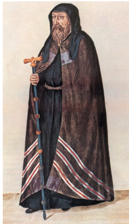
Πατριάρχης της εποχής της Τουρκοκρατίας. Γεννάδειος Βιβλιοθήκη.

Οι Οθωμανοί, λόγω θρησκευτικού φανατισμού αλλά και για λόγους κυριαρχίας συχνά εξισλάμιζαν βίαια τους υπόδουλους. Αλλά και κάποιοι χριστιανοί στις ορθόδοξες κοινότητες της Βαλκανικής και της Μικράς Ασίας άλλαζαν πίστη, προκειμένου να ανέλθουν κοινωνικά και οικονομικά. Άλλοι ασπάζονταν επιφανειακά το Ισλάμ, ενώ κρυφά συνέχιζαν την ορθόδοξη πίστη και ζωή ως κρυπτοχριστιανοί . Η θέση τους ήταν εξαιρετικά δύσκολη, γι' αυτό και η Εκκλησία τους αντιμετώπισε με κατανόηση. Όταν όμως η κρυφή τους πίστη γινόταν φανερή, κατέληγαν στο μαρτύριο και στο θάνατο. Έτσι εμφανίστηκαν οι νεομάρτυρες (μάρτυρες των νεότερων χρόνων), οι οποίοι προέρχονταν από τους κρυπτοχριστιανούς αλλά και από όσους άντρες και γυναίκες φανερά ομολογούσαν την πίστη τους. Η στάση τους απέναντι στο θάνατο θυμίζει τη στάση των πρώτων μαρτύρων και είχε μεγάλη απήχηση στη λαϊκή συνείδηση. Ο άγιος Νικόδημος ο Αγιορείτης συγκέντρωσε και διέσωσε τους βίους και το μαρτύριό τους στο βιβλίο του «Νέον Μαρτυρολόγιον».