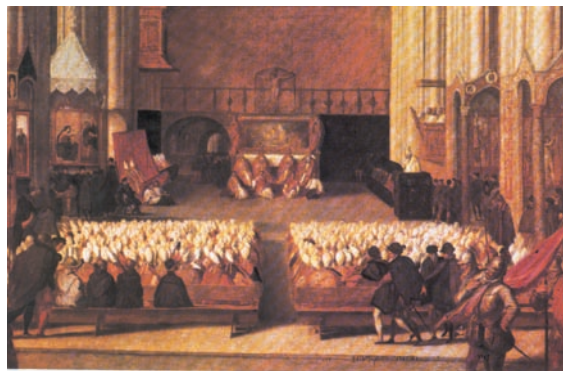
Σύνοδος του Τριδέντο. Πίνακας της εποχής.

Στη Σύνοδο του Τριδέντο και γενικά στην Αντιμεταρρύθμιση πρόσφεραν μεγάλες υπηρεσίες οι Ιησουϊτες. Το μοναχικό αυτό τάγμα ιδρύθηκε από τον Ισπανό στρατιωτικό Ιγνάτιο Λογιόλα . Αναγνωρίστηκε από τον πάπα Παύλο Γ' το 1540. Ως ιδεώδες του τάγματος ορίστηκε η ιεραποστολική δράση. Σε σύντομο χρονικό διάστημα η δράση των Ιησουϊτών εξαπλώθηκε σε διάφορες χώρες, χριστιανικές και μη. Το τάγμα οργανώθηκε καλύτερα και πήρε αντιπροτεσταντικό χαρακτήρα, γι' αυτό και προκάλεσε ισχυρές αντιδράσεις. Οι Ιησουϊτες, όπως ήδη έχουμε αναφέρει, διακρίθηκαν στα γράμματα, στην επιστημονική έρευνα και στην παιδαγωγική πρακτική. Σκοπός