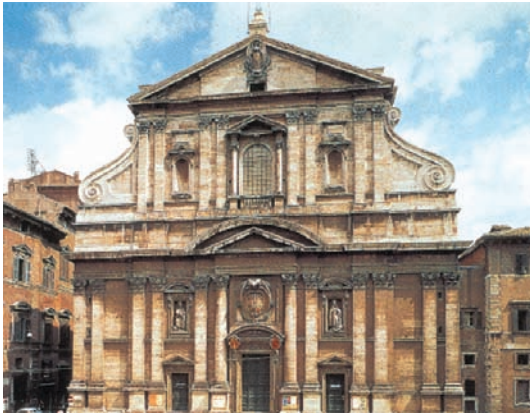
Ναός του Ιησού στη Ρώμη. Ρυθμός μπαρόκ.