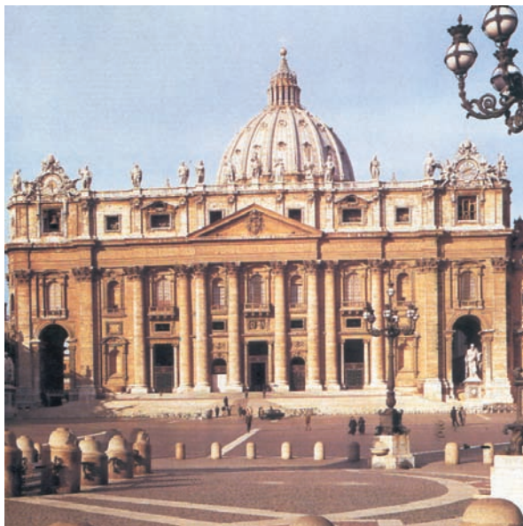
Πρόσοψη της Βασιλικής του Αγ. Πέτρου, Βατικανό. Ρυθμός Μπαρόκ.

Ο ρυθμός μπαρόκ εμφανίζεται σε χώρες που έμειναν πιστές στο Ρωμαιοκαθολικισμό, δηλαδή στην Ιταλία, Ισπανία, Αυστρία, νότια Γερμανία, Πολωνία, Φλάνδρα – Βέλγιο. Γι' αυτό, εκτός από το ναό του Αγίου Πέτρου και το ναό του Ιησού στη Ρώμη, χαρακτηριστικούς ναούς μπαρόκ βλέπουμε σήμερα στο Τολέδο της Ισπανίας (Άγιος Ιωάννης), στη Βιέννη (Άγιος Κάρολος Μπορομέο), στην Κρακοβία της Πολωνίας (Άγιος Πέτρος). Ο ρυθμός μπαρόκ επιβλήθηκε και στη Λατινική Αμερική, ιδιαίτερα στο Μεξικό, από τους Ιησουΐτες μοναχούς που συνόδεψαν τους Ισπανούς και Πορτογάλους κατακτητές.