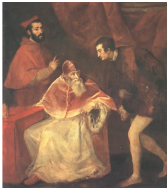
Πάπας Παύλος Γ'. Εθνικό Μουσείο Καποντιμόντε, Νάπολη, Ιταλία.