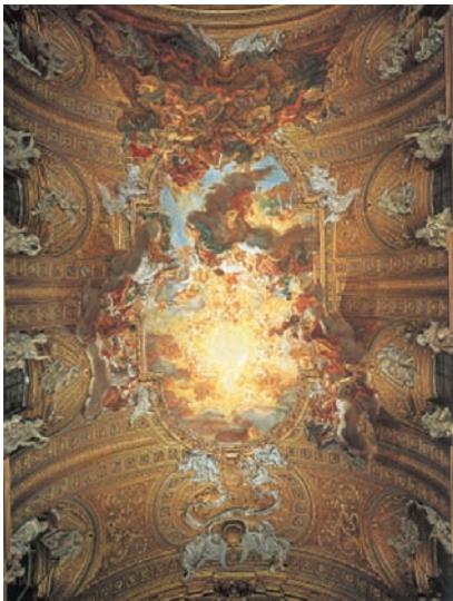
Οροφή του ναού του Ιησού στη Ρώμη. Ρυθμός Μπαρόκ.