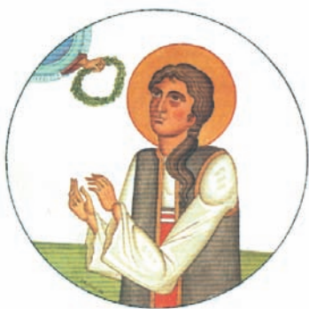
Νεομάρτυρας. Έργο του Γ. Κόρδη.

Από τις τάξεις του κλήρου προέρχονται και πολλοί εθνομάρτυρες. Ονομάζονται έτσι, εκτός από τους λαϊκούς αγωνιστές, και όσοι κληρικοί πριν, κατά τη διάρκεια αλλά και μετά από την επανάσταση του 1821, θυσίασαν τη ζωή τους για την πατρίδα, συμμετέχοντας σε πολεμικές συγκρούσεις (Αθανάσιος Διάκος, Παπαφλέσσας, Ησαΐας Σαλώνων κ.ά.). Η απόφασή τους να χρησιμοποιήσουν όπλα κατά συνανθρώπων τους ήταν εξαιρετικά δύσκολη, γιατί ως χριστιανοί και μάλιστα κληρικοί δεν επιτρεπόταν να διαπράξουν φόνο. Η Εκκλησία αντιμετώπισε με συγκατάβαση και ανοχή την συμπεριφορά τους, γιατί διακινδύνευσαν να χάσουν την ψυχή τους προκειμένου να υπερασπιστούν τα ιερά και τα όσια του λαού τους και να υπηρετήσουν αξίες όπως η αυτοδιάθεση των λαών και ελευθερία.