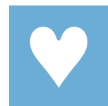
Η έκθεση του σχολείου μας

4.3.3. Διδ. στόχος: Να συνεργάζεται με τα πρόσωπα εκτός σχολείου. Δραστηριότητες: Έκθεση προϊόντων από τα εργαστήρια του σχολείου μας, στην τοπική αγορά.