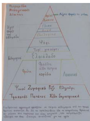
Η Διατροφική Πυραμίδα