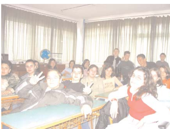
Στην Αίθουσα προβολής