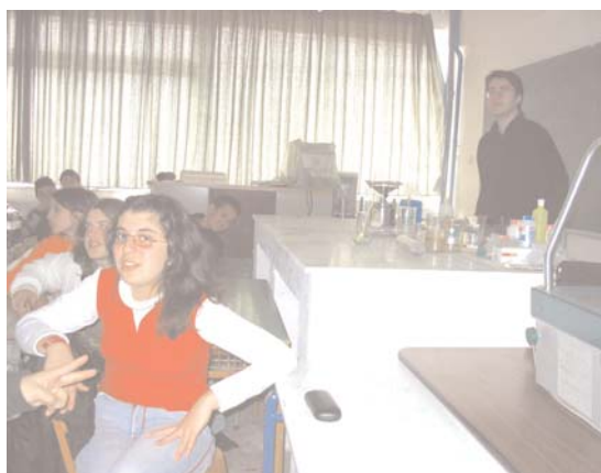
Στην Αίθουσα προβολής

Οι μαθητές χωρίστηκαν σε ομάδες των τεσσάρων ατόμων και ασχολήθηκαν με ένα συγκεκριμένο θέμα. Η α΄ ομάδα με το ιστορικό-κοινωνικό πλαίσιο, η β΄ ομάδα με το Θαλή, η γ΄ ομάδα με τον Πυθαγόρα και η δ΄ ομάδα με το Ζήνωνα. Επισκέφθηκαν τη βιβλιοθήκη του Δήμου Κομοτηνής, τη βιβλιοθήκη του σχολείου, ασχολήθηκαν με τη μελέτη βιβλίων των μαθηματικών και πήραν πολλές πληροφορίες από το Internet.