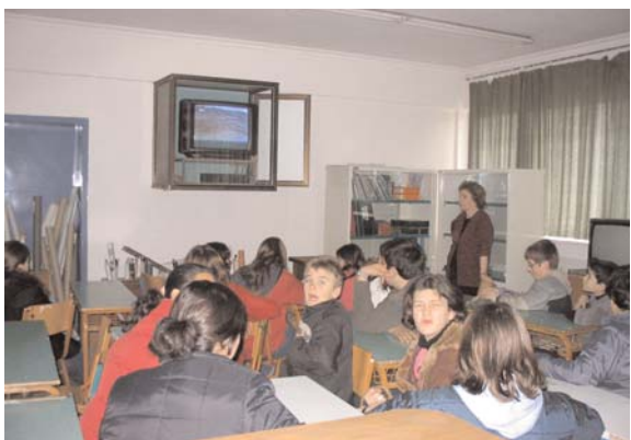
Στην αίθουσα προβολής βίντεο