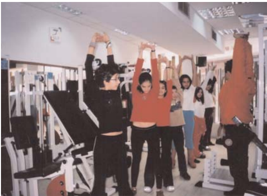
Άσκηση σε κλειστό χώρο