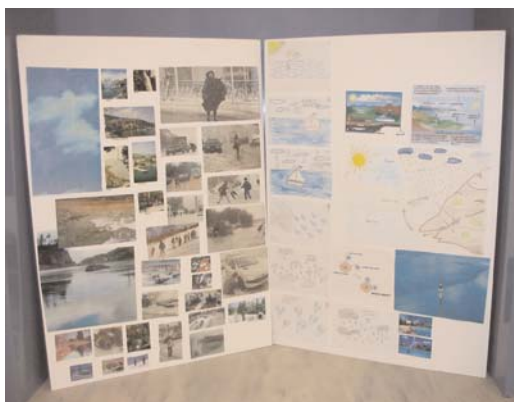
Φωτογραφικό υλικό για το θέμα