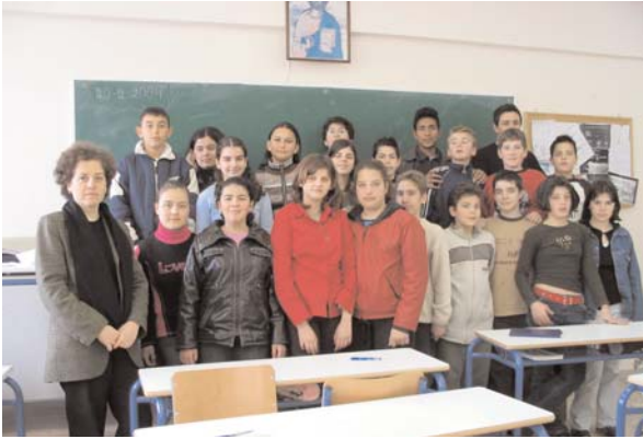
Αναμνηστικό από τη λήξη του προγράμματος