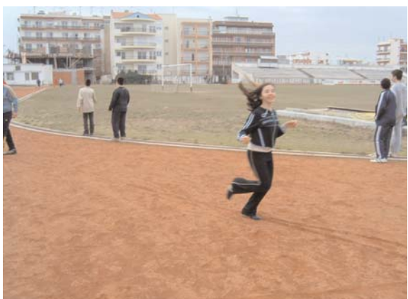
Επαφή των μαθητών με τους αθλητικούς χώρους