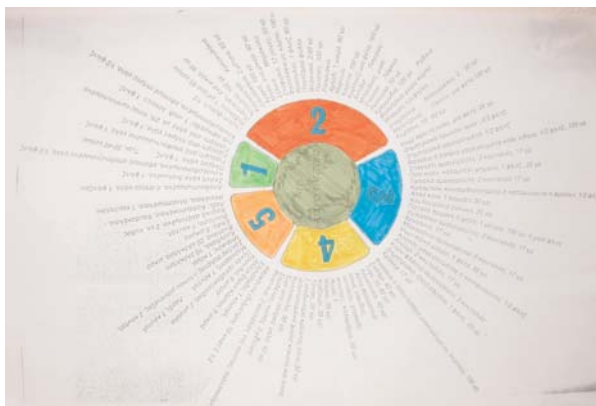
Το Άστρο της ζωής