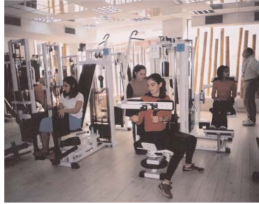
Εφαρμογή στην πράξη της άσκησης