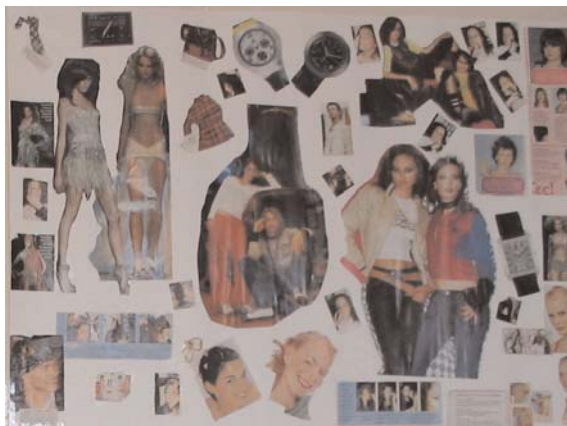
Κολάζ σχετικό με το θέμα: Μόδα - Ενδυμασία