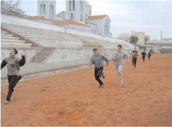
Στο εθνικό στάδιο Κομοτηνής...