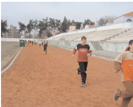
Εφαρμογή στην πράξη της άσκησης