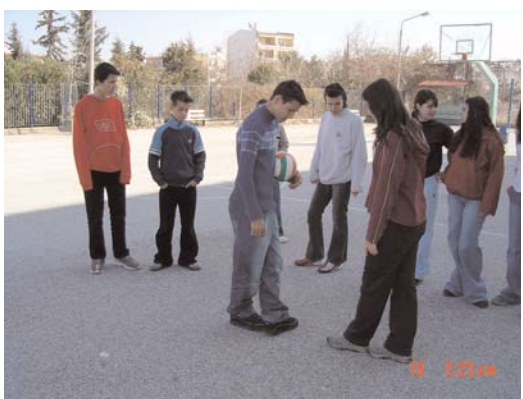
ΔΙΑΧΩΡΙΣΜΟΣ ΤΩΝ ΠΑΙΚΤΩΝ ΣΕ ΟΜΑΔΕΣ ΜΕ ΒΗΜΑΤΑΚΙΑ