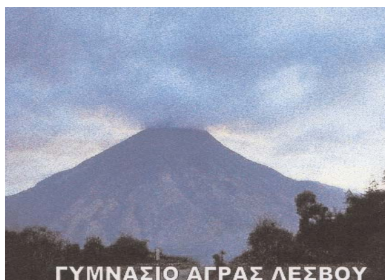
ΓΥΜΝΑΣΙΟ ΑΓΡΑΣ ΛΕΣΒΟΥ