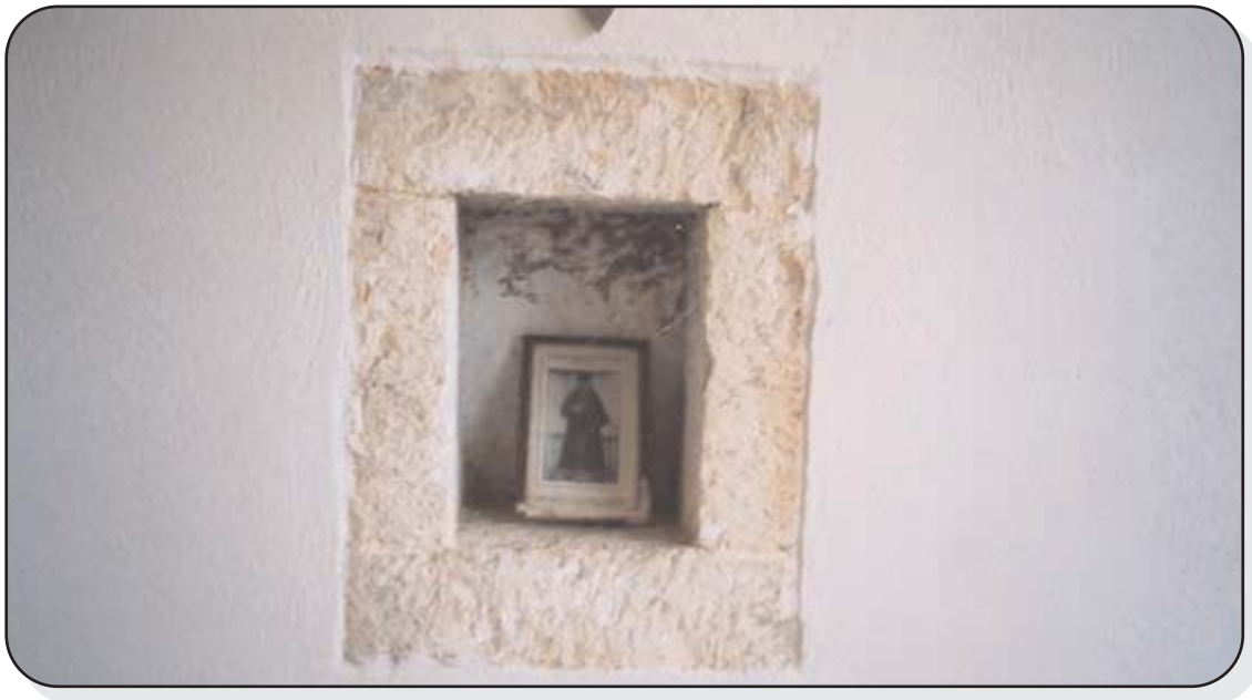
Η εικόνα του Αγίου Κοσμά στο μοναστήρι του Προφήτη Ηλία

Σε ομιλία που έκανε προς τους κατοίκους, ανέπτυξε τους λόγους, που επέβαλαν την