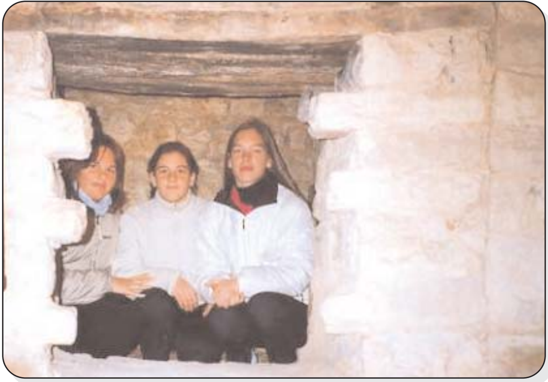
Είσοδος του κρυφού σχολείου

Το 1764 ο Άγιος Κοσμάς ο Αιτωλός, κάνοντας την πρώτη του περιοδεία, πέρασε από τη Ζίτσα και φιλοξενήθηκε στο μοναστήρι. Εκεί έμαθε για τη διακοπή της λειτουργίας του Σχολείου. Σύμφωνα με την παράδοση, επέπληξε γι' αυτό τον ηγούμενο.