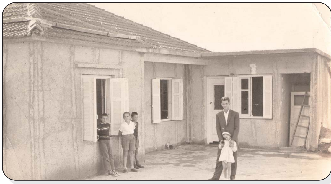
Το Γυμνάσιο στην οικία Λιάκου

Μέχρι τότε η Ζίτσα, με τα εκπαιδευτήρια που είχε και τις υποτροφίες που έδιναν κάποιοι ευεργέτες, αριθμούσε πολλούς γραμματισμένους και επιστήμονες. Σε όλη την Ήπειρο είχε αποκτήσει το όνομα του πιο μορφωμένου και ανεπτυγμένου χωριού.