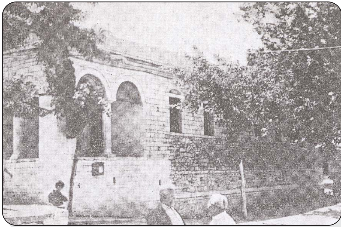
Το παλιό Δημοτικό Σχολείο

Το 1858 τα μοναστήρια του Αϊ-Λιά και των πατέρων έχτισαν με δαπάνες τους το Δημοτικό σχολείο κοντά στο καφενείο «Καλλιθέα». Μέχρι το 1872 το σχολείο λειτούργησε μικτό. Τότε δημιουργήθηκε χωριστό Παρθεναγωγείο. Δίπλα στους Ταξιάρχες στεγαζόταν το Σχολαρχείο.