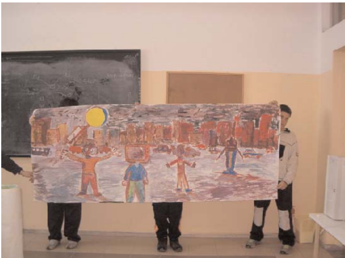
Ένα από τα δύο μεγάλης έκτασης έργα της ζωγραφικής

και συλλογικά προβλήματα. Έτσι, καταλήγουν, εξ αδυναμίας ή εκ πεποιθήσεως, «λαθρεπιβάτες», κατά την έκφραση του Olson (1991), στο κοινωνικό σύστημα. Η ομαδοσυνεργατική διδασκαλία αποβλέπει, μεταξύ των άλλων, στην ανάπτυξη τέτοιων δεξιοτήτων και στάσεων, που εξασφαλίζουν τις προϋποθέσεις επιτυχίας του ατόμου και ελαχιστοποίησης των προβλημάτων. 1 »