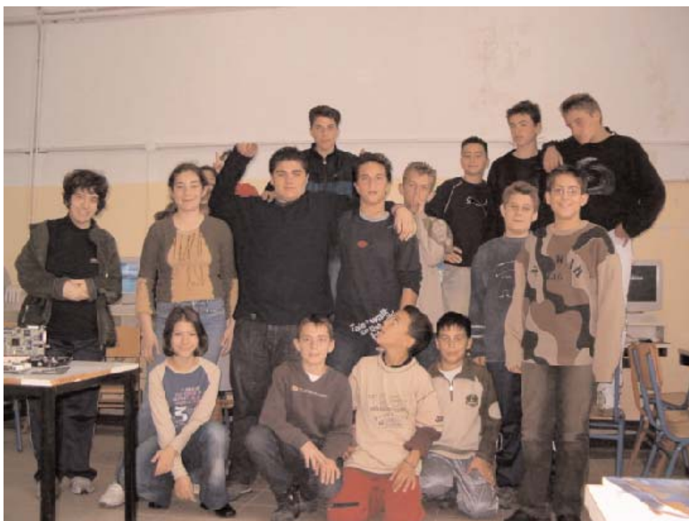
Η ομάδα της «ιστοσελίδας» μέσα στο εργαστήριο πληροφορικής