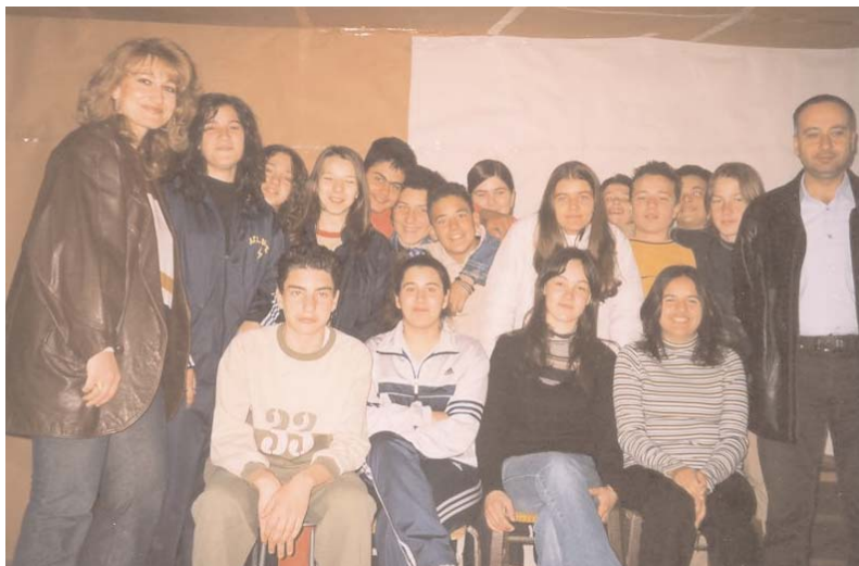
Φωτογραφίες της θεατρικής ομάδας πάνω στη σκηνή