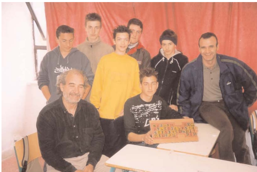
Φωτογραφίες από το πρόγραμμα