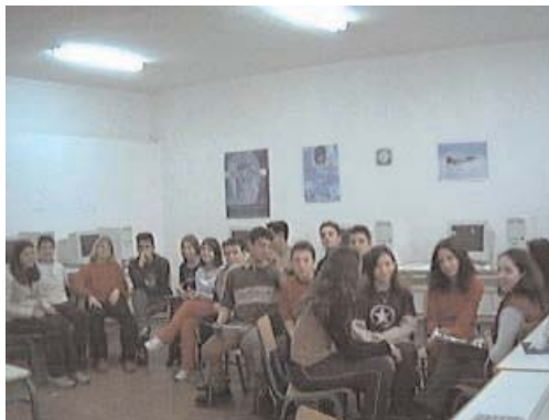
Ένα στιγμιότυπο των δραστηριοτήτων της ευέλικτης ζώνης

Η διεύθυνση της ιστοσελίδας είναι: http://gym-sochou.thess.sch.gr/euelikti_zoni.htm