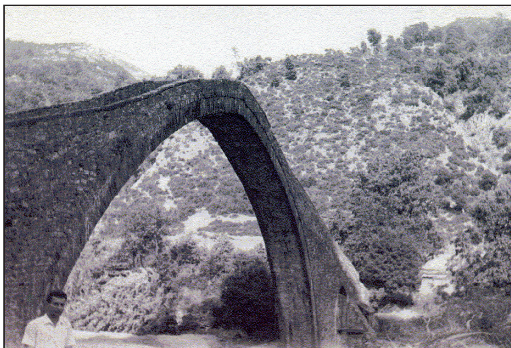
Το γεφύρι του Μανώλη

Κατά την παράδοση το γεφύρι του Μανώλη έλαβε το όνομά του από τον πρωτομάστορα Μανώλη, ο οποίος καταγόταν, κατά μία άποψη, από το χωριό Δάφνη