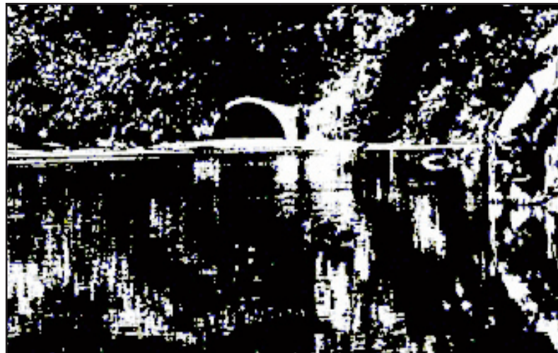
Η παλαιά γέφυρα της Τατάρνας

Στη θέση της παλαιότερης γέφυρας της Τατάρνας χτίστηκε το 1965, με τη δημιουργία της τεχνητής λίμνης των Κρεμαστών, η ομώνυμη νεώτερη γέφυρα που συνδέει σήμερα οδικώς τους δύο όμορους νομούς Ευρυτανίας και Αιτωλοακαρνανίας.