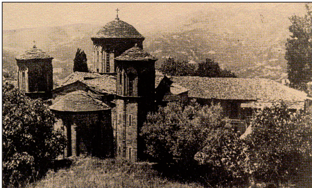
Η ιστορική μονή της Τατάρνας

Σύμφωνα με την παράδοση, η μονή της Τατάρνας είναι βυζαντινή. Κατά μία εκδοχή, ιδρύθηκε στα 1.111 μ.Χ., ενώ άλλοι τη θεωρούν «βασιλομονάστηρο», το οποίο ιδρύθηκε τον 13ο αιώνα μ.Χ., από την Αγία Θεοδώρα, Βασίλισσα της Άρτας. Ερείπια αυτής της πρώτης, «βυζαντινής» φάσης του μοναστηριού διακρίνονται ακόμη και σήμερα στη θέση «Παληομονάστηρο». Η ονομασία Τατάρνα ή Τετάρνα είναι πιθανώς σλαβικής προέλευσης, κατά την επικρατέστερη θεωρία, και σημαίνει «τόπος με πλούσια βλάστηση», περιγράφει δηλαδή αυτό που πράγματι διαπιστώνει κανείς «ιδίους όμμασι», όταν επισκέπτεται την περιοχή.