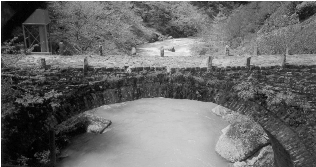
Το πέτρινο γεφύρι