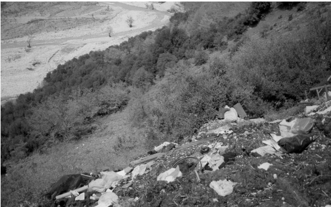
Σκουπίδια κοντά στο ποτάμι

Φυσικά - Μελέτη του Περιβάλλοντος: με αφορμή το νερό των ποταμών, μιλήσαμε για το νερό στη φύση, και πόσο πολύτιμο αγαθό είναι για τον άνθρωπο. Τέθηκε το πρόβλημα της ρύπανσης των νερών και μιλήσαμε για τρόπους καθαρισμού του. Επισημάνθηκε από τους ίδιους τους μαθητές η σημασία των υδροβιότοπων για τη συνέχιση της ζωής πάνω στον πλανήτη. Πειραματιστήκαμε με το νερό (το νερό στις τρεις καταστάσεις της ύλης, πήξη, τήξη, υγροποίηση, διήθηση, απόσταξη κ.ά.). Σημαντικό χρόνο αφιερώσαμε στην ανάγκη προστασίας του περιβάλλοντος από την ανεξέλεγκτη αμμοληψία και απόρριψη σκουπιδιών και τονίσαμε τις ολέθριες συνέπειες για το οικοσύστημα.