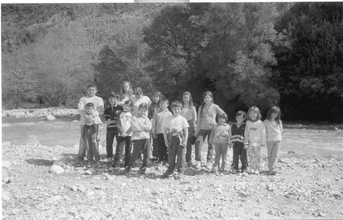
Τα παιδιά του σχολείου στο ποτάμι