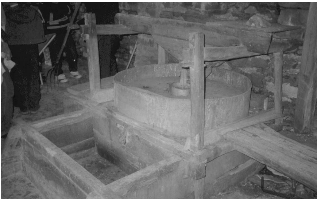
Το εσωτερικό του νερόμυλου

Μαθηματικά: Διατύπωση και επίλυση προβλημάτων ποσοστών, δημιουργία στατιστικών πινάκων, γραφικών παραστάσεων, εύρεση όγκου και εμβαδού. Σημαντικό υλικό τα παιδιά εντόπισαν σε μια επίσκεψη στον παλιό νερόμυλο του χωριού, πλάι στο ποτάμι, παίρνοντας συνέντευξη από τον τελευταίο μυλωνά του. Εκεί κατανόησαν έννοιες όπως φύρα, ξάι (=αλεστικά, πληρωμή σε είδος με ποσοστό έναντι του συνολικού βάρους του καλαμποκιού). Μάλιστα, έπειτα από παρότρυνση του ίδιου του μυλωνά, δημιούργησαν επιτόπου προβλήματα ποσοστών, συναλλαγών, κ.τ.λ.