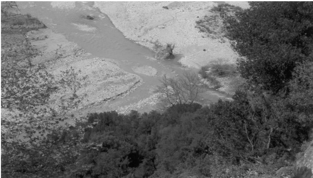
Η «σμίξη» (η συμβολή των δύο παραποτάμων)