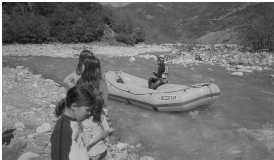
Αθλητικές δραστηριότητες στο ποτάμι

Κοινωνική και Πολιτική Αγωγή: η επίσκεψη στον παλιό νερόμυλο έδωσε την ευκαιρία στα παιδιά να αντιληφθούν τον τρόπο με τον οποίο γινόταν παλιότερα η ανταλλαγή των αγαθών και των υπηρεσιών, καθώς και την επιρροή του περιβάλλοντος στην εκλογή του επαγγέλματος. Έγινε λόγος για τη δράση των κοινωνικών φορέων και έγινε παιχνίδι ρόλων (Δήμαρχος, ομάδα πολιτών, μαθητές - συνέλευση με θέμα: «Η προστασία του ποταμού - τρόποι τουριστικής αξιοποίησης του»- παρατηρήσεις - συζήτηση - αποφάσεις - ενέργειες.