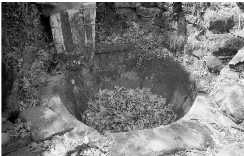
Η νεροτριβή του νερόμυλου

Γλώσσα: παραγωγή προφορικού και γραπτού λόγου με αφορμή σύνταξη ερωτηματολογίων, λήψη προφορικών συνεντεύξεων, σύνταξη επιστολής προς τον Δήμαρχο (ολόκληρη η επιστολή υπάρχει στο τέλος του σχεδίου εργασίας) με θέμα την προστασία του παραποτάμιου οικοσυστήματος από τη ρύπανση του υδροφόρου ορίζοντα και με προτάσεις για την τουριστική αξιοποίηση της περιοχής, την ανάδειξη και αποκατάσταση των πολιτιστικών μνημείων, που σχετίζονται με το ποτάμι (γεφύρια, νερόμυλοι, νεροτριβές).