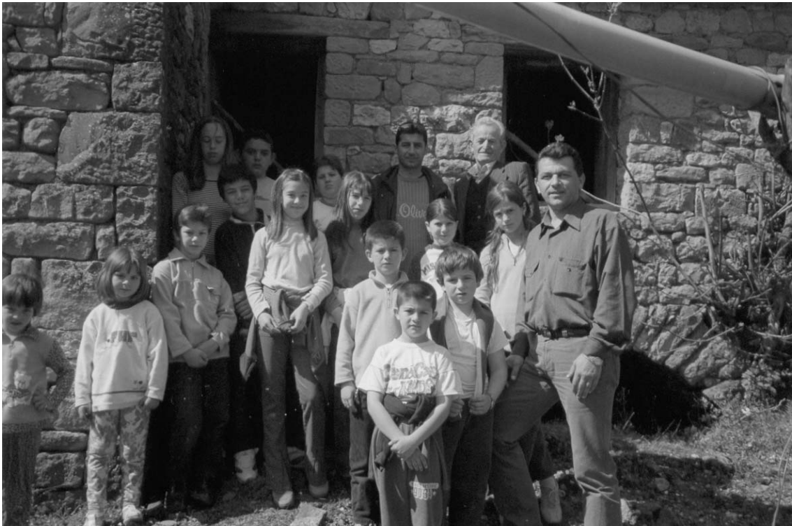
Επίσκεψη στο νερόμυλο του χωριού