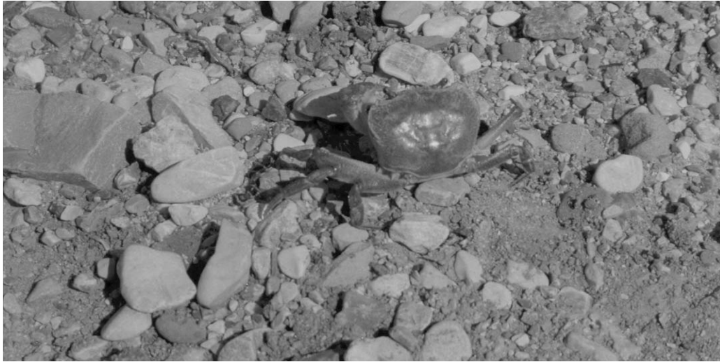
Από την πανίδα του ποταμού (κάβουρας)

Φυσικά - Μελέτη του Περιβάλλοντος: με αφορμή το νερό των ποταμών, μιλήσαμε για το νερό στη φύση, και πόσο πολύτιμο αγαθό είναι για τον άνθρωπο. Τέθηκε το πρόβλημα της ρύπανσης των νερών και μιλήσαμε για τρόπους καθαρισμού του. Επισημάνθηκε από τους ίδιους τους μαθητές η σημασία των υδροβιότοπων για τη συνέχιση της ζωής πάνω στον πλανήτη. Πειραματιστήκαμε με το νερό (το νερό στις τρεις καταστάσεις της ύλης, πήξη, τήξη, υγροποίηση, διήθηση, απόσταξη κ.ά.). Σημαντικό χρόνο αφιερώσαμε στην ανάγκη προστασίας του περιβάλλοντος από την ανεξέλεγκτη αμμοληψία και απόρριψη σκουπιδιών και τονίσαμε τις ολέθριες συνέπειες για το οικοσύστημα.