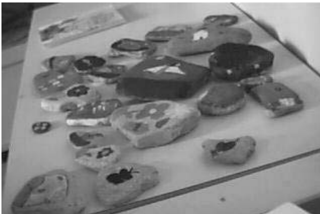
Ζωγραφική σε βότσαλα του ποταμού

Αισθητική Αγωγή - Δημιουργική Έκφραση: Ζωγραφική: τα παιδιά συγκέντρωσαν βότσαλα από το ποτάμι και εκφράστηκαν ζωγραφίζοντας πάνω σ' αυτά θέματα σχετικά με τη χλωρίδα και την πανίδα της περιοχής. Μουσική: τραγούδησαν παραδοσιακά τραγούδια που αναφέρονται στο ποτάμι. Θέατρο: έγινε θεατρικό παιχνίδι, αντλώντας θέματα από τη ζωή σε παλιότερες εποχές, υποδυόμενοι ρόλους, όπως του μυλωνά, του ψαρά κ.τ.λ.. Κατασκευές: έφτιαξαν αφίσσα με κολλάζ.