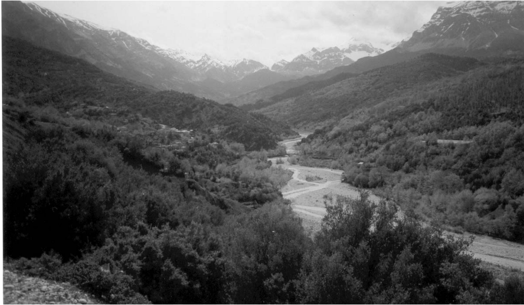
Αποψη του χωριού